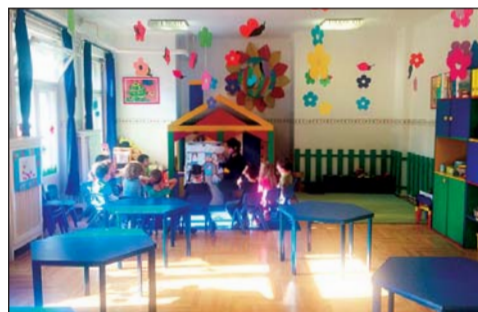
Az óvoda specialitása az angol nyelv oktatása.

A világ megismerése a tevékenykedésen keresztül történik, így a napirendi foglalkozásokon kívül olyan egyéb programokkal színesítjük a hétköznapokat, mint a hagyományörző táncszínházak, sportnapok, madarászóvi, korcsolya, úszás, bábszínház, állatkert, kulturális programok.