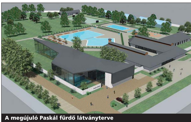
A megújuló Paskál fürdő látványterve

és a nyári időszakban azzal locsolni a kerteteket. A Gödöllői-dombságból eredő és a Dunába torkolló Rákos-patak átfolyik a XIV. kerületen. Útközben több kisebb ér is táplálja. Víztartóssága nem tökéletes, ami elsősorban a patak talajvíz-jellegéből következik. Az önkormányzat szeretné elérhetővé változtatni a Rákos-patak partját és közvetlen környezetét. A tervek szerint helyenként kanyargósabbá tennék a patakot,