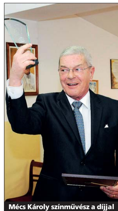
Mécs Károly színművész a díjjal

Az Élesszínben lépett fel Galla Miklós humorista, zenesz, a Holló Színház megalkotója. Az élceket, minitörténeteket és poénokat előadó humorista az életéről, a humor és a közönség változó viszonyáról, valamint a terveiről is mesélt lapunknak.