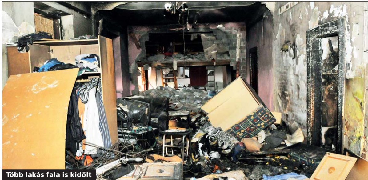
Több lakás fala is kidőlt

Bár a Cserei utcai társasházban volt vezeték gáz, a balesetben elsődlegesen érintett lakásban mégis PB-gázpalackot használtak. Téglalapú házakban ugyan ezt semmi nem tiltja, de a biztonságos üzemeltetéshez komoly szabályokat kell betartani.