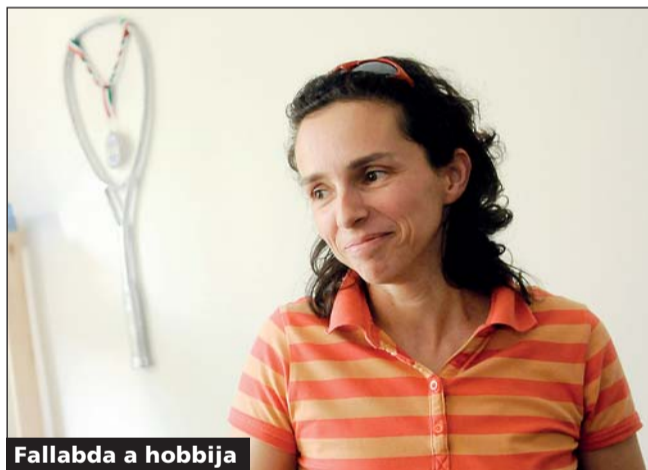
Fallabda a hobbija

Tavaly kezdett újból fallabdázni, először csak a