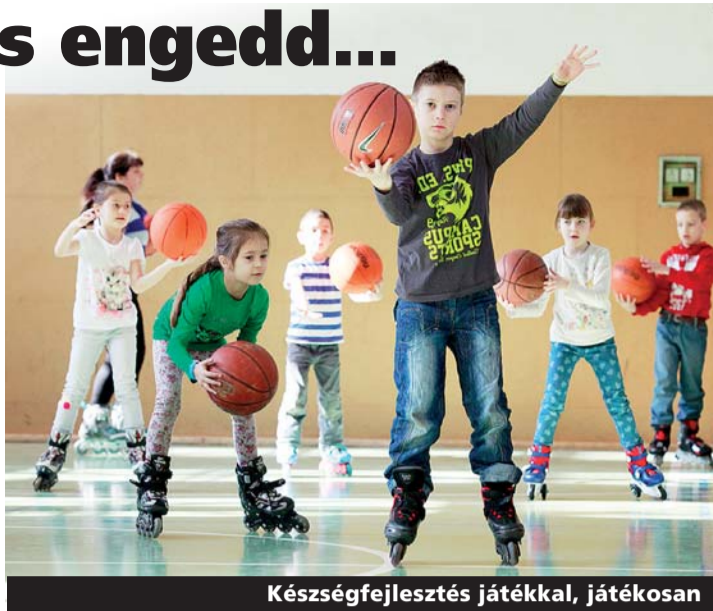
Készségfejlesztés játékkal, játékosan

Az egy héten át tartó programsorozaton csaknem ezer pedagógus és nevelő ismerkedett meg a játékpedagógia különböző módszereivel, esz-