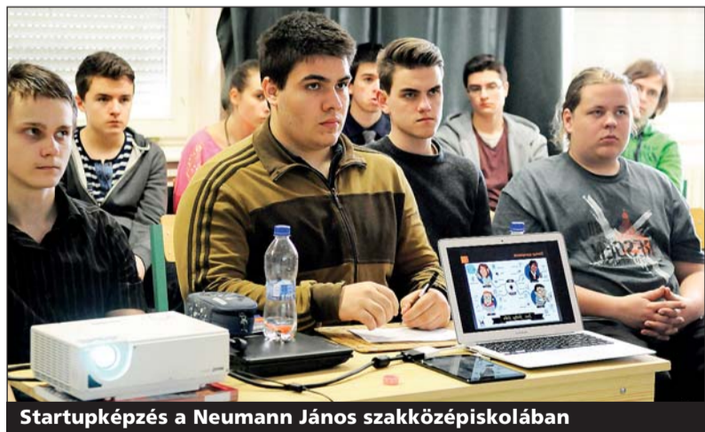
Startupképzés a Neumann János szakközépiskolában

umannban folyó munkát régről ismertük, tudjuk, hogy az ott tanuló diákok tele vannak ötletekkel, ezért úgy gondoltuk, hogy az első képzést itt indítjuk el.