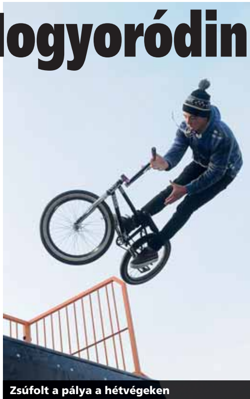
Zsúfolt a pálya a hétvégeken