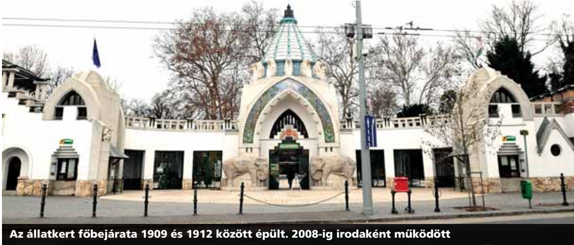
Az állatkert főbejárata 1909 és 1912 között épült. 2008-ig irodaként működött