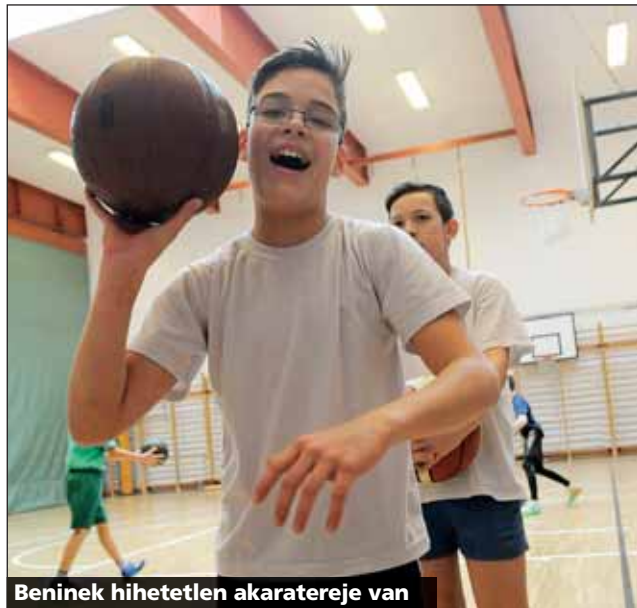
Beninek hihetetlen akaratereje van

A család és az iskola folyamatosan várja a felajánlásokat a 10700206-43547104-52400009-es számlaszámra. R. T.