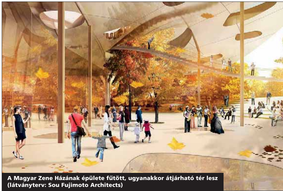
A Magyar Zene Házának épülete fűtött, ugyanakkor átjárható tér lesz (látványterv: Sou Fujimoto Architects)

A zsúfolt VI. és VII. kerületnek a Városliget a kertje! Mindannyiunknak érdeke lenne megvédeni. Szerinte az építészek meg akarják mutatni, mit tudnak a 21. században, de óvott attól, hogy ezt a Városligetben tegyék.