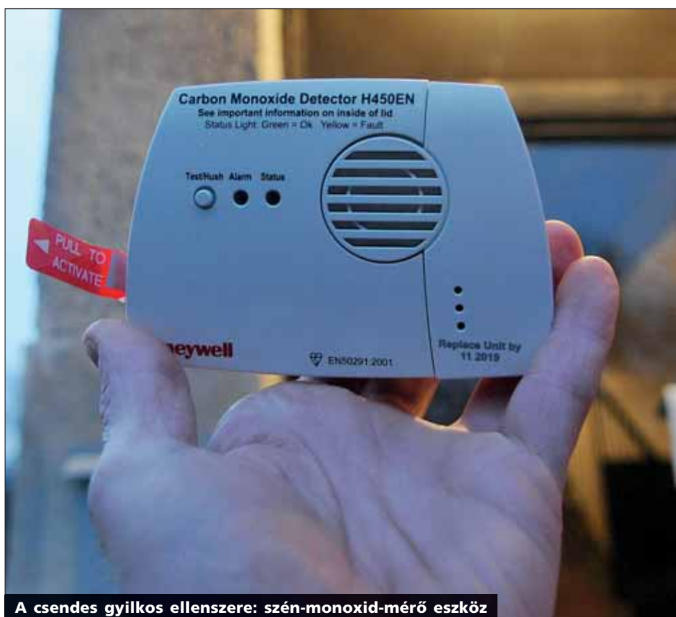
A csendes gyilkos ellenszere: szén-monoxid-mérő eszköz