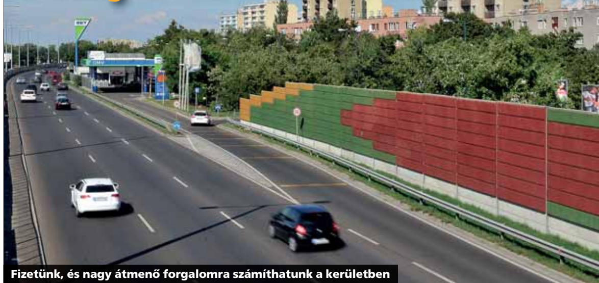
Fizetünk, és nagy átmenő forgalomra számíthatunk a kerületben

Útdíjat kell fizetnünk január 1-jétől. Az új szabályozás érvényes az M0-s körgyűrű nagy részére és az autópályák – köztük az M3-as – fővárosba vezető szakaszaira a Budapest határát jelző tábláig. Az érintett utakon akkor is meg kell vásárolni az e-matricát, ha ezt tábla nem jelzi.