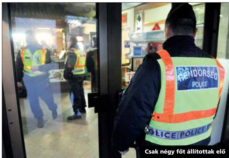
Csak négy főt állítottak elő

Meglehetősen kevés bűncselekmény történt az ünnepek alatt Zuglóban. Köszönhetően a rendőrség hagyományos év végi akciójának, amikor is folyamatosan fokozott ellenőrzéseket tartottak a kerület frekvenciált részein. Az akció november 25-től január 5-ig tartott, és ezalatt 212 egyenruhás és civil ruhás rendőr 64 gépjárművel 2016 órát töltött a közterületeken. Az akcióval megcélzott helyek a többnyire forgalmas terek, a bevásárlóközpontok és környékeik, a dohányboltok, a közlekedési csomópontok és a pénzügyi intézetek környezetei voltak. A több mint egy hónapos ellenőrzés során a 120 ezres lélekszámú kerületben mindössze 4 főt állítottak elő, 2 szabálysértési feljelentést tettek, 2 alkalommal szabtak ki helyszíni bírságot, egy biztonsági intézkedés történt. Az elmúlt egy hónapban azonban több rendhagyó esemény is történt a kerületben, vizsgálatuk még folyamatban van. (Riersch)