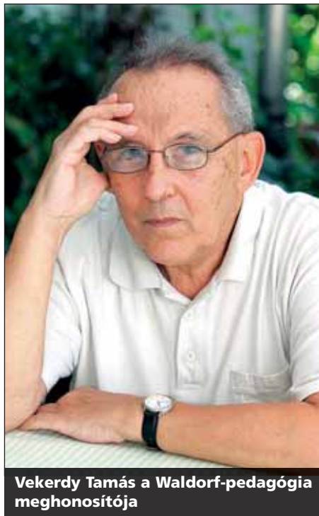
Vekerdy Tamás a Waldorf-pedagógia meghonosítója

– A Waldorf-iskola nem azt mondja, hogy legyél az, akivé én akarlak tenni. Igyekeznek kibontakoztatni a gyerek adottságait. Továbbá érzelmek nélkül nincs hatékony tanulás, a művészetek rendkívül jelentős szerepet játszanak a nevelésben, akárcsak a kézzel végzett tevékenységek, a kézimunka, a kézművesség, a házépítés vagy a földmégmunkálás, de még a szociális munka is. A Waldorf-iskolának három nagyon fontos területe van: a közismeret, a művészetek és a kézzel végzett tevékenységek, amelyek a praktikus intelligenciát fejlesztik. Az alapítása óta lassan kilencven év telt el, nem ment ki a divatból, hanem egyre inkább