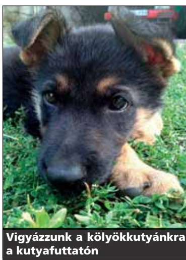
Vigyázzunk a kölyökkutyánkra a kutyafuttatón

értsen” velük. A dolog nehézsége, hogy a szociálisan legérzékenyebb időszak egybeesik az immunológiai legsebezhetőbb periódussal. Ilyenkor a kölyköt már nem védik az anyai ellenanyagok, a vakcinák pedig még nem alakították ki a megfelelően erős védelmet. A legjobb megoldás, ha a második oltás után keresünk egy olyan helyet, ahol nem járhattak idegen kutyák. Ott rendszeresen összeengedhetjük kiskutyánkat egy másik, rendszeresen oltott játszótárral. A kutyafuttatók a fertőzésveszély miatt nem felelnek meg erre a célra.