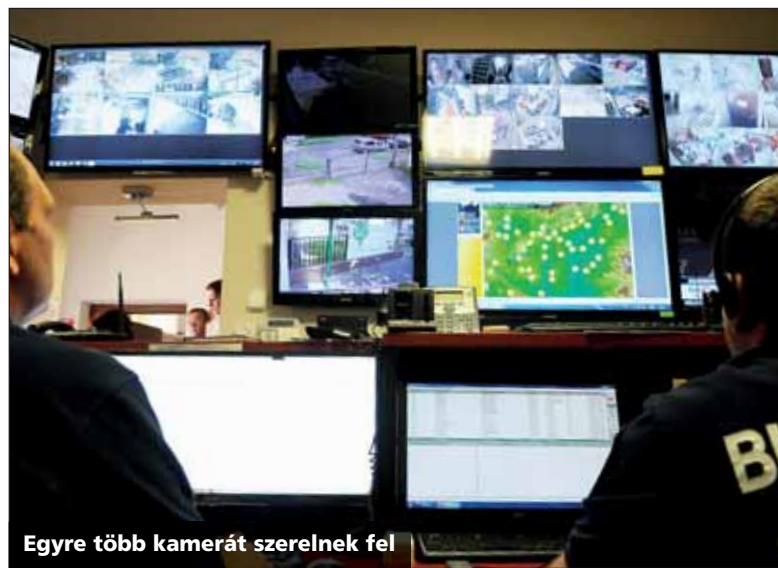
Egyre több kamerát szerelnek fel

lakástűznél is intézkednek. Azt mondja, a köszönőlevelekből úgy tűnik, több esetben életet is mentettek.