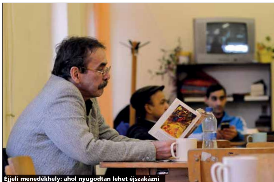
Éjjeli menedékhely: ahol nyugodtan lehet éjszákázni

Vágány utca 3. Nyitva: 17 óra és reggel 8 óra között, hétfőn és ünnepnapokon 16 órától. Feltétel: 7 hónapnál nem régebbi tüdőszűrőlet. Telefon: 06-1-320-1640