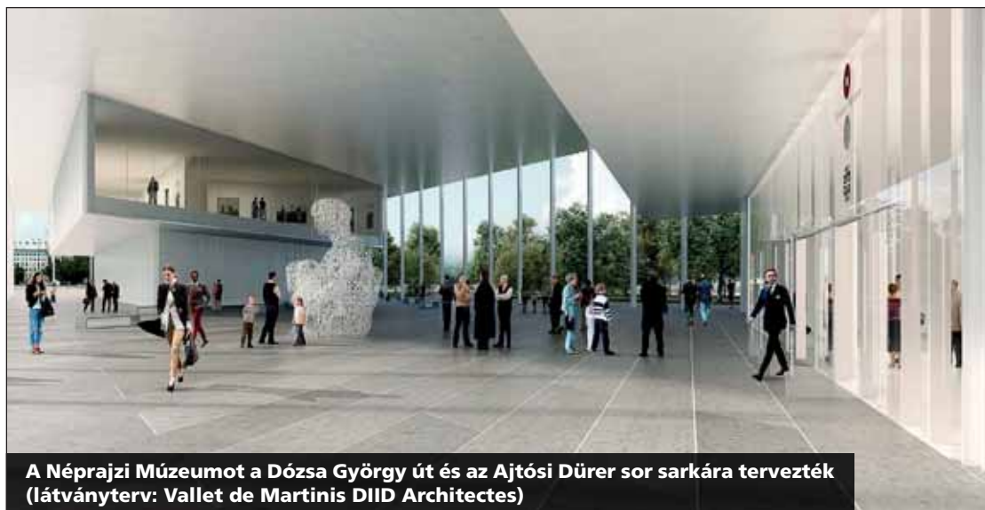
A Néprajzi Múzeumot a Dózsa György út és az Ajtósi Dürer sor sarkára tervezték (látványterv: Vallet de Martinis DIID Architectes)

– Sajnos a tervek alapján látszik, nem voltak alaptalanok a fák kivágása, a Városliget tönkretétele miatt aggódók félelmei. Ráadásul szó sincs a korábban beharangozott, nemzetközi mércével mérve is jelentős építészeti alkotásokról. A négy megismert terv közül csupán a Magyar Zene Házáé érdekes, ám a fakivágással létrehozott erdőélmény abszurd. A fák lombkoronájába emelt 80 méter átmérőjű tető elnyomja a környezetét.