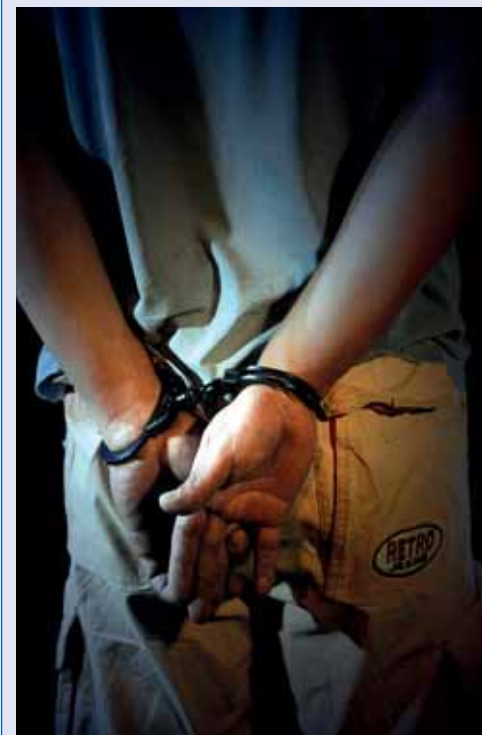
A következményekkel számolni kell

Még a szilveszteri parti hatása alatt volt az a két férfi, akit körülbelül fél óra eltéréssel igazoltattak az Őrs vezér terén. Zavart viselkedésük feltűnt a rendőröknek. A 31 esztendőes férfi megpróbált meglógni, ám a járőröknek sikerült utolérniük, és egy zacskó, kb. két gramm speedet találtak nála, amit a szilveszteri buliból hozott. A másik személyt az aluljáró lépcsőjénél igazoltatták, nála egy zacskó marihuánát találtak, amiből a szilveszteri partin fogyasztott.