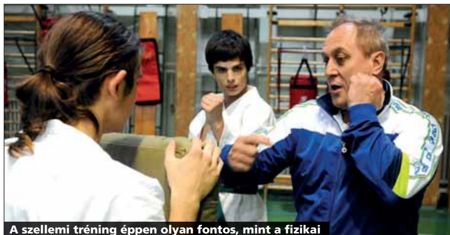
A szellemi tréning éppen olyan fontos, mint a fizikai

Két aranyat és még 9 érmet hozott Zuglónak és persze iskolájának a Neumann János Karate ISK csapata a Shito-ryu Karate Világkupáról. A Komplex3+T tehetséggyógyító programot is tesztelte az iskola a Budaörsön rendezett országos versenyen.