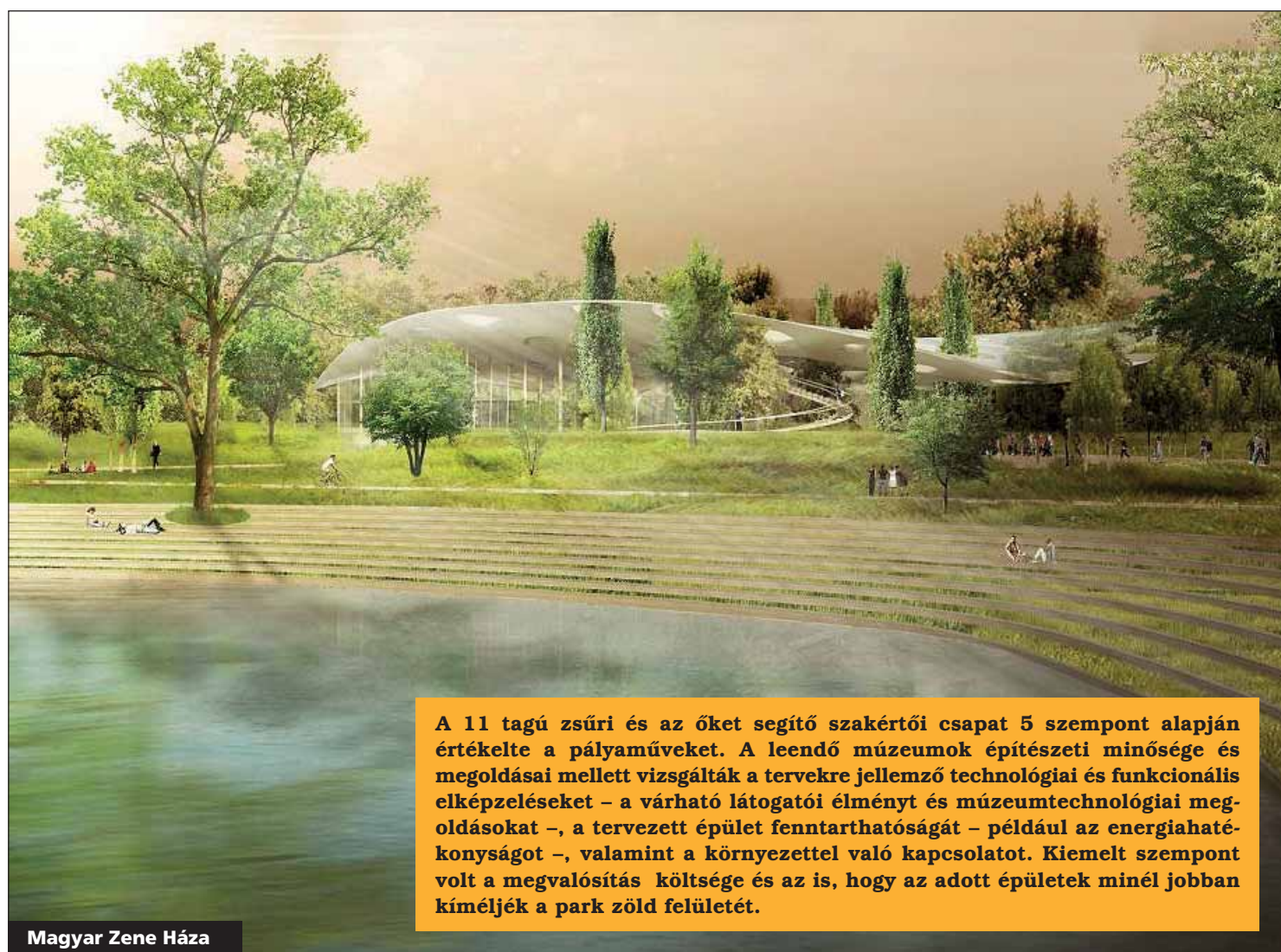
Magyar Zene Háza

A 11 tagú zsűri és az őket segítő szakértői csapat 5 szempont alapján értékelt a pályaműveket. A leendő múzeumok építészeti minősége és megoldásai mellett vizsgálták a tervekre jellemző technológiai és funkcionális elképzeléseket – a várható látogatói élményt és múzeumtechnológiai megoldásokat –, a tervezett épület fenntarthatóságát – például az energiahatékonyságot –, valamint a környezettel való kapcsolatot. Kiemelt szempont volt a megvalósítás költsége és az is, hogy az adott épületek minél jobban kímélik a park zöld felületét.