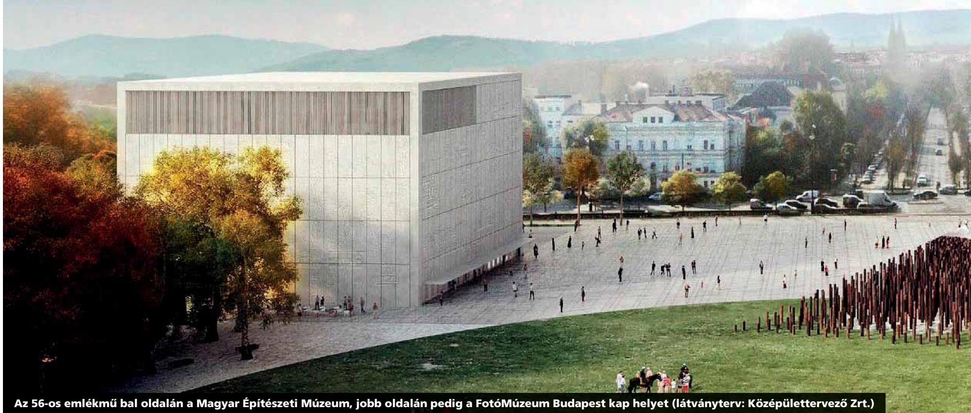
Az 56-os emlékmű bal oldalán a Magyar Építészeti Múzeum, jobb oldalán pedig a FotóMúzeum Budapest kap helyet (látványterv: Középülettervező Zrt.)

Kihirdették a Városligeti múzeumi pályázatok eredményeit. A zsűri 470 pályaműből választotta ki a legjobbakat. A Néprajzi Múzeum egy francia, a Magyar Zene Háza egy japán tervező, míg a FotóMúzeum Budapest és a Magyar Építészeti Múzeum ikerépülete a magyar Középülettervező Zrt. elképzelései alapján épülhet meg. A zsűri egyedül az Új Nemzeti Galéria – Ludwig Múzeum épületéhez nem talált még megfelelő pályamunkát.