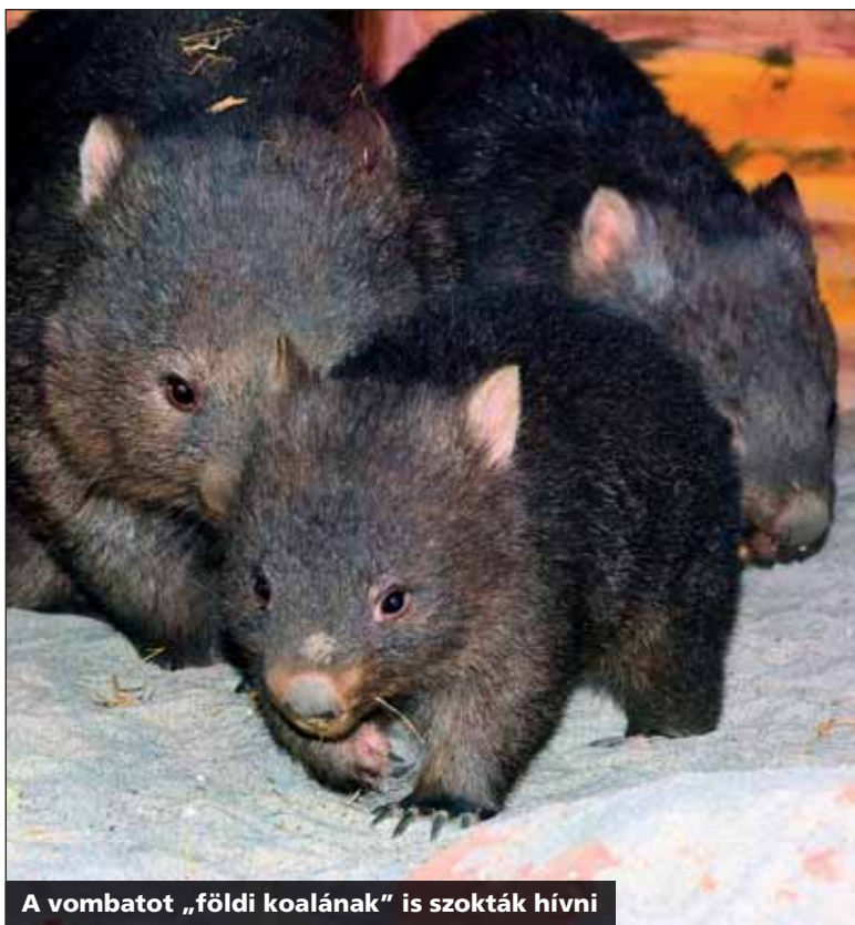
A vombatot „földi koalának” is szokták hívni

Az állatkert tíz éve próbál koalához jutni, január végére, a Mackó-fesztiválra megérkezhet az állatpár. A Vidám Park helyére tervezett Pannon Park előkészítése folyamatban, a cirkusz melletti Mese-