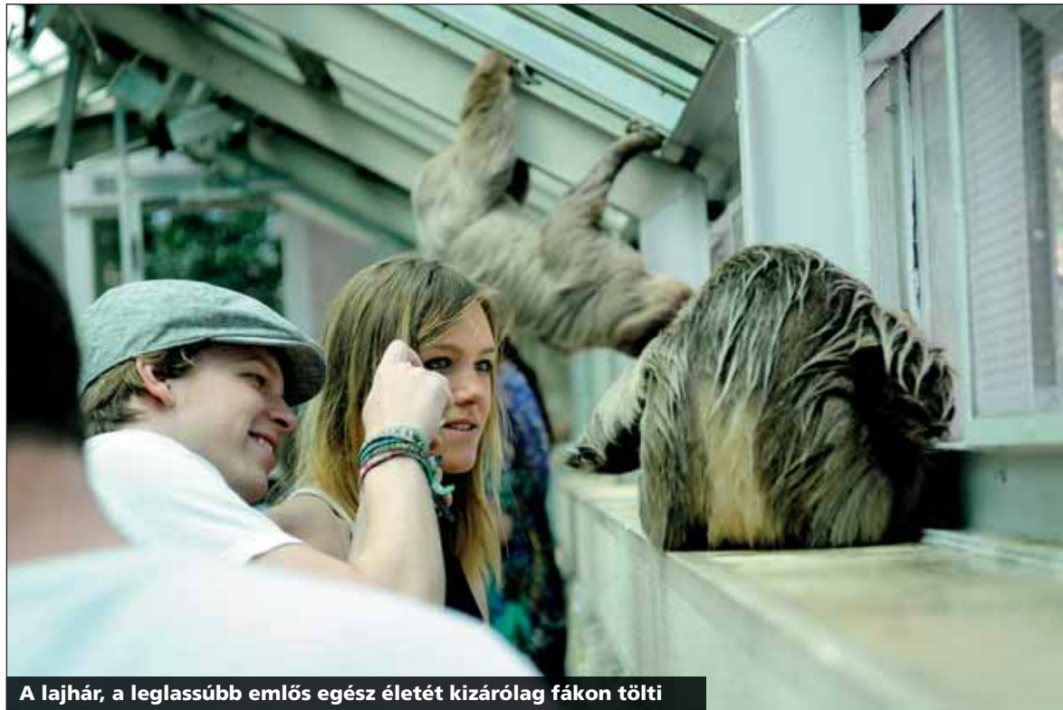
A lajhár, a leglassúbb emlős egész életét kizárólag fákön tölti

– Az új családi szabadidőparkban ünnepelte Zugló fennállásának 79. évfordulóját. Az intézmény hosszú évek óta együttműködést ápol a