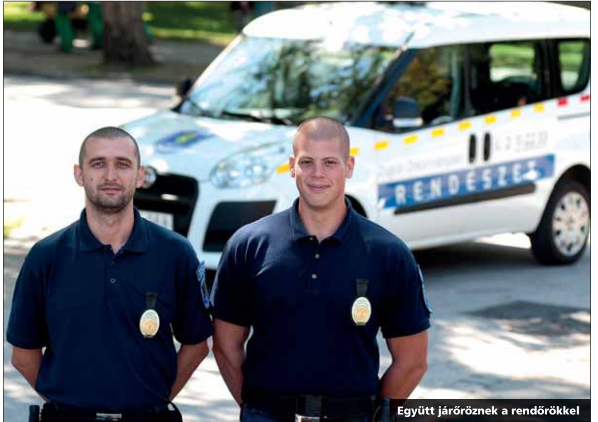
Együtt járőröznek a rendőrökkel

ügyben tudnak intézkedni – mondta Kardos. Hozzátette, ha baj van, ott a segítség is. Szinte minden héten előfordul, hogy az utcán rosszul lett vagy megsérült emberhez mentőt hívnak. Sőt a mentő kiérkezéséig ápolják is a bajba kerülteket. Mentettek már ki autóst a Rákos-patakból, de