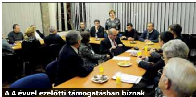
A 4 évvel ezelőtti támogatásban bíznak

Az Egyesült Nemzetek Szervezete 1992. december 18-án fogadta el a nemzeti vagy etnikai, vallási és nyelvi kisebbségekhez tartozó személyek jogairól szóló nyilatkozatot, amely a jogok gyakorlását nemcsak az egyéneknek, hanem azok közösségeinek is lehetővé teszi. A magyar kormány 1995 szeptemberében döntött arról, hogy hazánkban minden év december 18-án tartásuk a kisebbségek napját. Az Országgyűlés 2012 áprilisában december 18-át a nemzetiségek napjává nyilvánította.