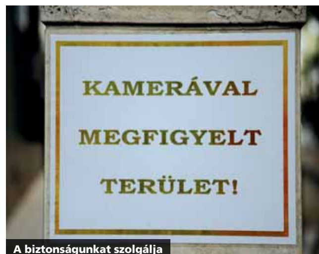
A biztonságunkat szolgálja