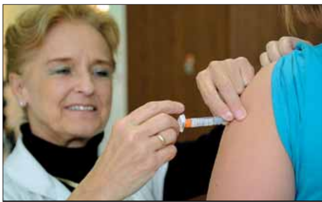
A hazánkban forgalomban lévő vakcinák inaktivált vírust vagy annak egy meghatározott részét tartalmazzák, ezért nem okozhatnak influenzás megbetegedést

Az influenza vírusos megbetegedés, amit orrfolyás, láz, köhögés, fejfájás, rossz közérzet, az orr és a légutak nyálkahártyájának duzzanata jellemző, cseppfertőzéssel terjed – sajnos minden évben. Helyi járványok 1-3 évente alakulnak ki. A legkifejezettebb járványokat az influenza A vírusa okozza. Hirtelen törnek ki, 2-3 hét alatt elérik csúcspontjukat, de általában 2-3 hónapig tartanak, és nemegyszer gyorsan lecsengenek. A 2003-as influenzajárványban 430 ezer beteget regisztráltak. 1950 és 2000 között tíz járványban körülbelül egymillió ember betegedett meg.