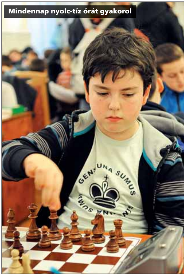
Mindennap nyolc-tíz órát gyakorol

A tizenkét éves diák természetesen szeretné veretlenül zárni az év hátralévő részét is, ám ehhez két rendkívül rangos versenyen kell jól szerepelnie. Október közepén Grúziában, Batumiban rendezik a korosztályos Európa-bajnokságot.