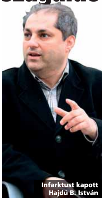
Infarktust kapott Hajdú B. István

Infarktust kapott Hajdú B. István. A népszerű sportriporter egy év szünet után ismét focizni próbált, de néhány pernyi játék után rosszul lett. Társai mentőt hívtak hozzá, és mivel az orvosok szívrohamot állapítottak meg nála, kórházba szállították, és rögtön meg is műtötték. Miután sikerült eltávolítani a közepes nagyságú vérrögöt a koszorúteréből, vérnyomása is lejjebb ment a foci után mért 210-es értékről. Hajdú B. István már jobban van, de az biztos, eddigi életformáján mindenképpen változtatnia kell. Az állandó rohanást, a stresszhelyzetet, illetve a rendszertelen életmódot nem bírja már a szervezete. A sportriporter sokáig egyet jelentett a Bajnokok Ligája magyar hangjával. Humorát ma már a Bundesliga- és az Európa-liga-mérkőzések közvetítésein csillogtatja. Hajdú B. sokáig Zuglóban lakott, több sportos esemény házigazdája volt itt. A kerület nevében jobbulást kívánunk, és egyben gratulálunk szeptemberben megszületett harmadik gyermekéhez. R.T.