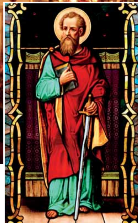
Szent Pál apostol: „A jó harcot megharcoltam, a pályát végigfutottam, a hitet megtartottam. Készen vár rám az igazság győzelmi koszorúja.”