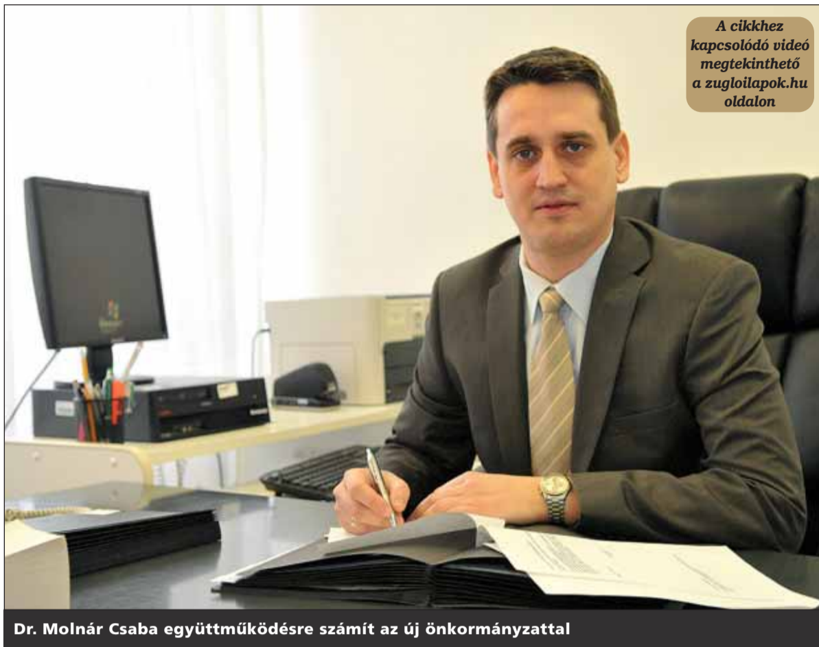
Dr. Molnár Csaba együttműködésre számít az új önkormányzattal

– Az állam, a kormány, amely eredetileg is felelős volt ezekért az ügyekért, azt gondolta, hogy a saját feladatait legjobb, ha ő, és nem a helyhatóságok, a jegyzők végzik el, ezért törvényileg visszavette saját hatáskörébe a feladatokat. A kormányhivatali egységként működő járási és kerületi hivatalokban elhivatott kormánytisztviselők dolgoznak, akik valóban egy „járásnyira” esnek az állampolgároktól, így az ügyintézés is sokkal hatékonyabb, mint az előző, sokszor koordinálatlan rendszerben. Egy helyen, közel az emberekhez, partnerként tekintve rájuk hatékony ügyintézés folytatunk – ez az alapfilozófiánk – fejtette ki Molnár Csaba. Felvetésünkre, hogy milyen kapcsolatra számít az ellenzéki vezetésű önkormányzattal, leszögezte, a kerületi hivatal az együttműködés mellett van.