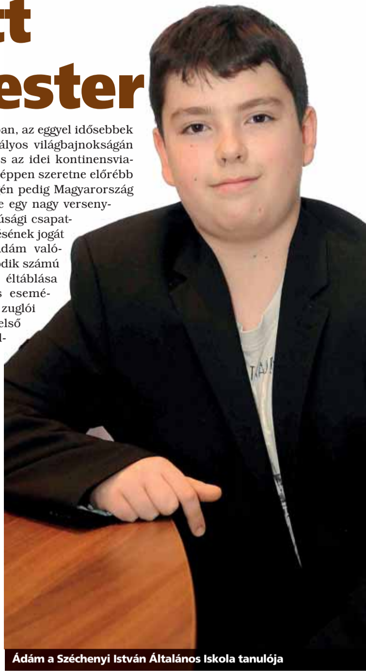
Ádám a Széchenyi István Általános Iskola tanulója