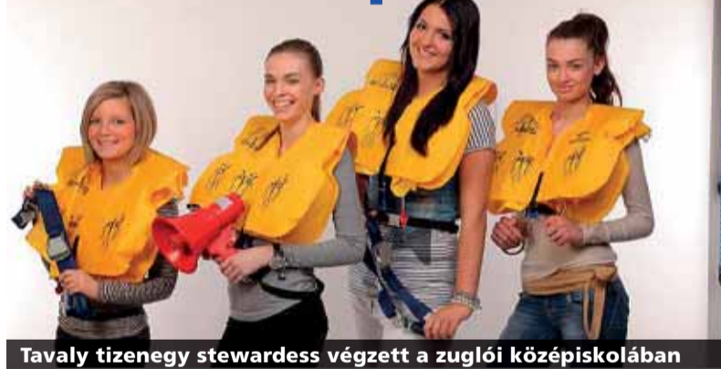
Tavaly tizenegy stewardess végzett a zuglói középiskolában

Az intézményben több területen is magas szintű szakképzés folyik. A turisztikai, a vendéglátási, a szakács-, pincér-, kereskedő-, pénzügytanácsadó- és a média-, illetve kommunikációs képzés mellett azonban a légiutaskísérő-képzés kuriózumnak számított. A programot sokáig megkönnyítette a magyar légitársaság, a Malév létezése, amely szakmai háttérrel és gyakorlatot, illetve vizsga- és munkalehetőséget biztosított a Zuglóból kikerülő légiutas-kísérőknek. Az Európa 2000 középiskolában ta-