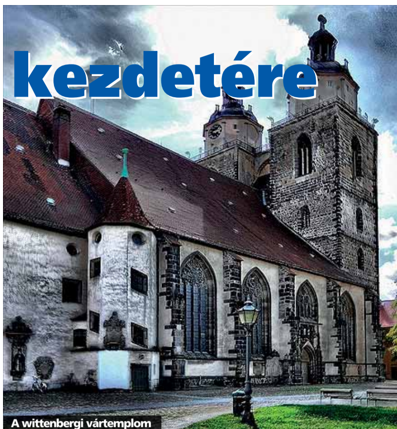
A wittenbergi vártemplom

kifüggesztés százötvenedik évfordulóján a II. János György szász választófejedelem által vezetett szászországi evangélikus