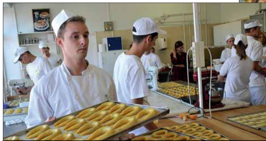
A pozsonyi kifli arany szabálya a töltelék – ami dió vagy mák lehet – és a tészta ötven-ötven százalékos aránya

rülhetetlen szabály a töltelék – ami dió vagy mák lehet – és a tészta arányának ötven-ötven százaléka. A hagyomány szerint egyébként az első hajlított édes kiflit egy bécsi pék sütötte 1683-ban, mégpedig Sobieski János lengyel király tiszteletére, aki legyőzte a Bécsset ostromló török ha-