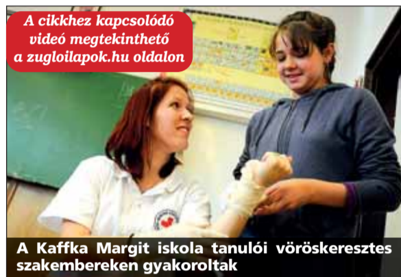
A Kaffka Margit iskola tanuló vöröskeresztes szakembereken gyakoroltak