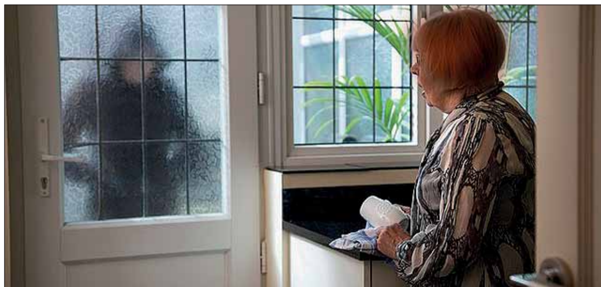
A sértettek legtöbbször idős emberek, akiket sokszor álmukból felébresztve, hajnalban csapnak be a tolvajok