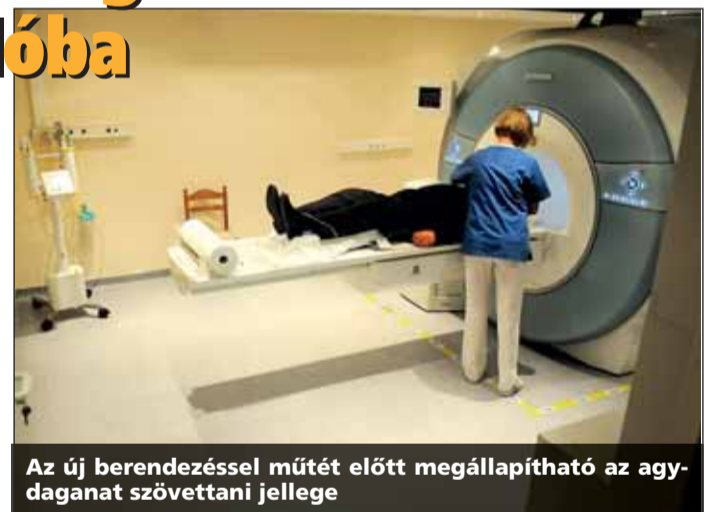
Az új berendezéssel műtét előtt megállapítható az agydaganat szövettani jellege

Dr. Zombor Gábor, az Emberi Erőforrások Minisztériumának egészségügyért felelős államtitkára az átadáson hangsúlyozta: a kormány az állami fenntartású országos intézeteket a társadalombiztosítási alapú egészségügyi ellátás zászlóshajóinak tekinti, ezért azokat megerősíti, kiemelten támogatja. Az OKITI-vel tárgyalásokat folytat