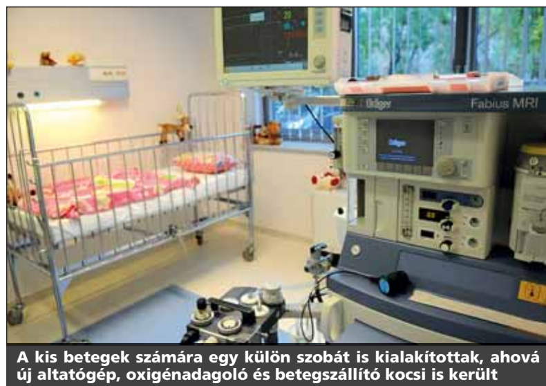
A kis betegek számára egy külön szobát is kialakítottak, ahová új altatógép, oxigénadagoló és betegszállító kocsit is került

Ezzel a kezdeményezéssel a Zuglói Egészségügyi Szolgálat kollektívája újabb fogyatékkal élő munkaerővel bővült. Az intézményben már korábban is hagyománya volt a fogyatékkal élők alkalmazásának, az egyik legrégebben ott dolgozó látássérült telefonközpontos 25 évnyi munkaviszony után nemrég ment nyugdíjba.