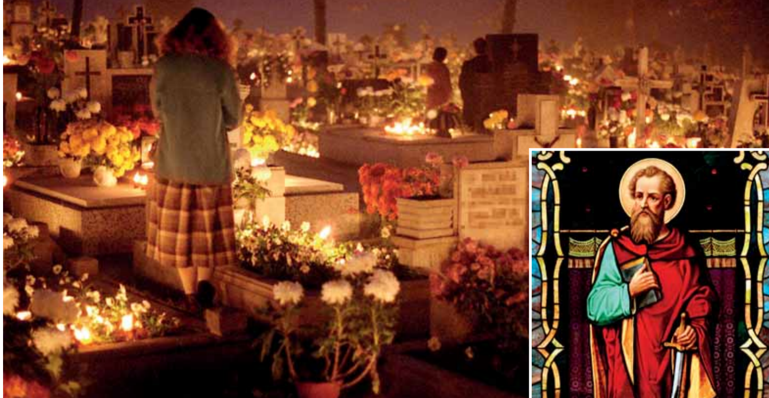
A mécses lángja az örök életet jelképezi, ám egyes hiedelmek szerint segítségével a halottak tévelygő lelkei visszatálnak a sírjukba

Mindenszentek napján egyébiránt a katolikusok a győzteseket, a célba jutottakat ünneplik. Azokat, akik nem a saját, hanem Isten akarata, vagyis a szeretet parancsa szerint éltek – és haltak. Ahogy Szent Pál apostol írta: „A jó harcot megharcoltam, a pályát végigfutottam, a hitet megtartottam. Készen vár rám az igazság győzelmi koszorúja.”