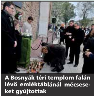
A Bosnyák téri templom falán lévő emléktáblánál mécseseket gyújtottak

A Bosnyák téren a Himnusz elneklésével vette kezdetét az ünnepség, majd Körtvélyessy Zsolt színművész Márai Sándor Mennből az angyal című versét mondta