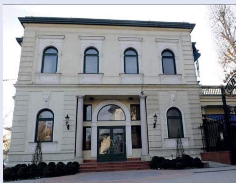
A városligeti Gundel éttermet 1910 óta üzemelteti a Gundel család

Bár a Zsolnay-gyár Pécsen működik, Zuglóban is volt egy alkotóműhelye. A pécsi üzem a technikai eljárásokat dolgozta ki, de a zuglói gyárral való együttműködésre volt szüksége a világhírnév eléréséhez. Számos épületkerámia található kerületünkben, amely Pécsen készült: ilyen a Zala-villa, a Múcsarnok vagy a Lechner Ödön által tervezett Állami Földtani Intézet.