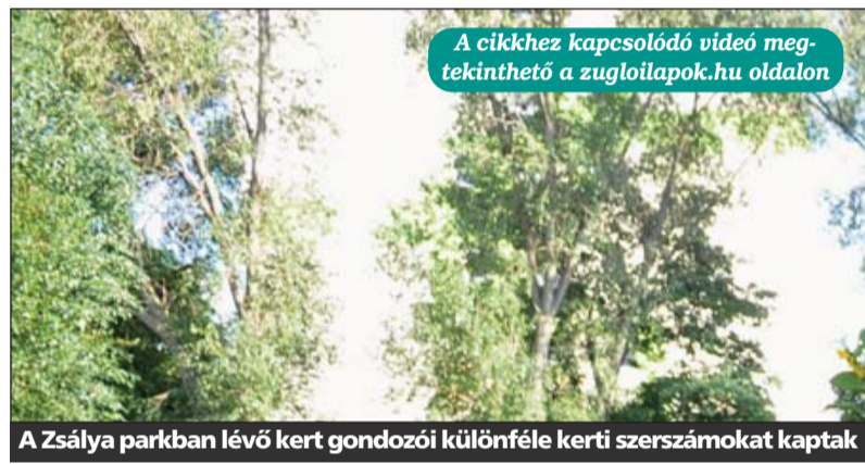
A Zsálya parkban lévő kert gondozói különféle kerti szerszámokat kaptak