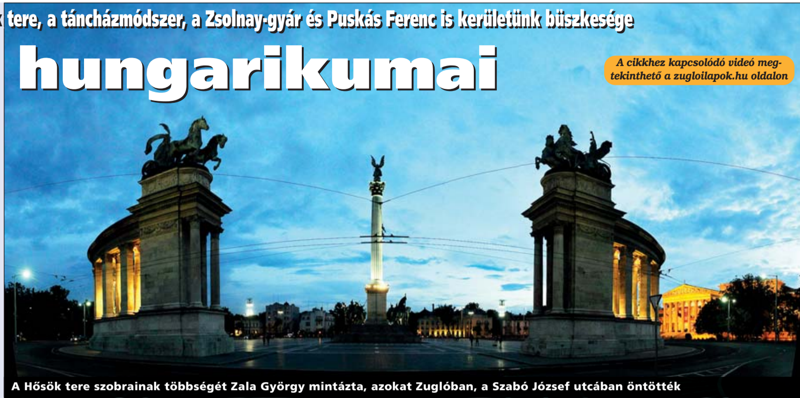
A Hősök tere szobrainak többségét Zala György mintázta, azokat Zuglóban, a Szabó József utcában öntötték

„A Gundel-dinasztia története tehát egyet jelent a magyar gasztronómia és a magyar vendéglátás történetével. Gundel Károly megszelídítette a magyar konyhát, s ötvözte azt a világból érkező be-