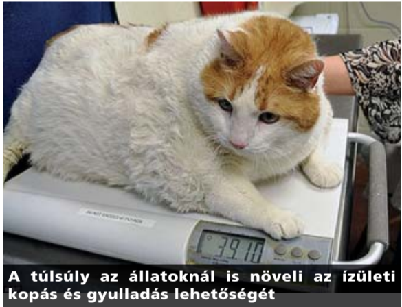
A túlsúly az állatoknál is növeli az ízületi kopás és gyulladás lehetőségét

Az ízületek kóros állapota valamilyen veleszületett mozgásszervi betegség, törés, fertőzés vagy szalagsérülés