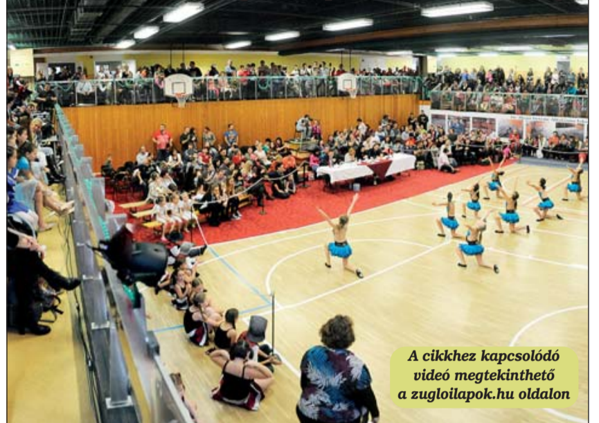
A cikkhez kapcsolódó videó megtekinthető a zugloilapok.hu oldalon

Több mint ezeröttszáz táncos nevezett be a XXVII. Zuglói Táncfesztiválra