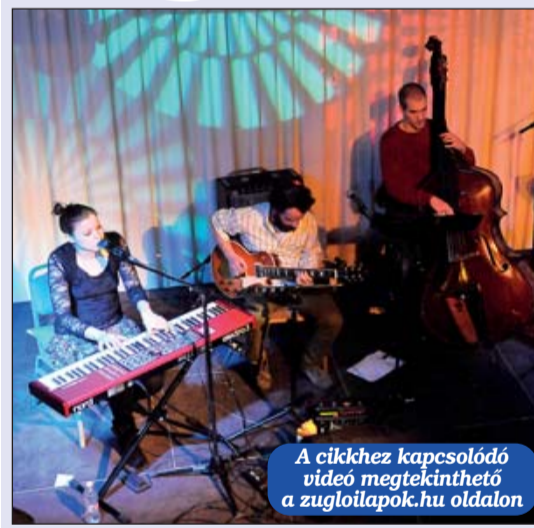
A cikkhez kapcsolódó videó megtekinthető a zugloilapok.hu oldalon