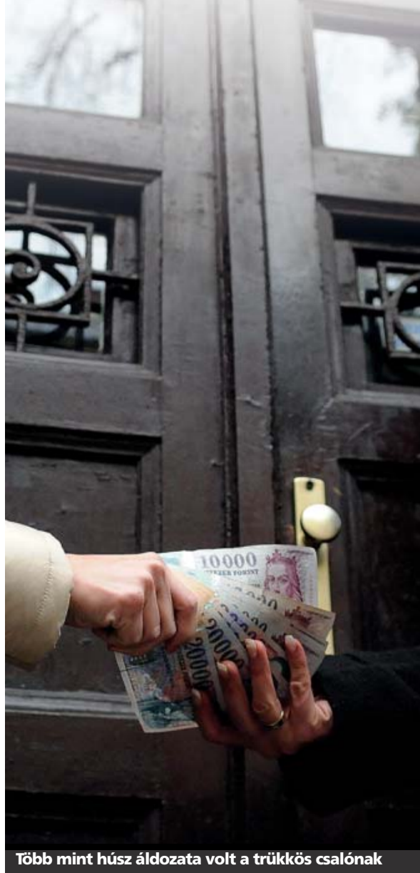
Több mint húsz áldozata volt a trükkös csalónak

Hihetetlen történettel kereste meg szerkesztőségünket egyik olvasónk. Elmesélte, hogy nyolc hónapos kisfiával május óta keres albérletet. Szeptember 28-án az egyik hirdetőoldalon olvasott egy Gyarmat utcai garzonlakásról, amelyet 50 ezer forintért kínáltak. Olvasónk felhívta a megadott telefonszámot, és a lakást már aznap megtekintette. A főbérlet – egy idősebb hölgy – nagyon kedves volt, azt mondta, az ingatlan az Angliában élő lányáé, akivel szeretné megbeszélni, hogy a jelentkezők közül kinek adja ki a lakást. Végül a fiatal asszonyra esett a választás. Másnap 19.00 órakor a Keleti pályaudvarnál találkoztak. Aláírták a bérleti szerződést, és itt kellett odaadnia a leendő albérletnek a kéthavi kauciót és az első havi bérleti díjat, összesen 150 ezer forintot. A főbérlet jelezte, két hétre van szüksége, hogy kiköl-