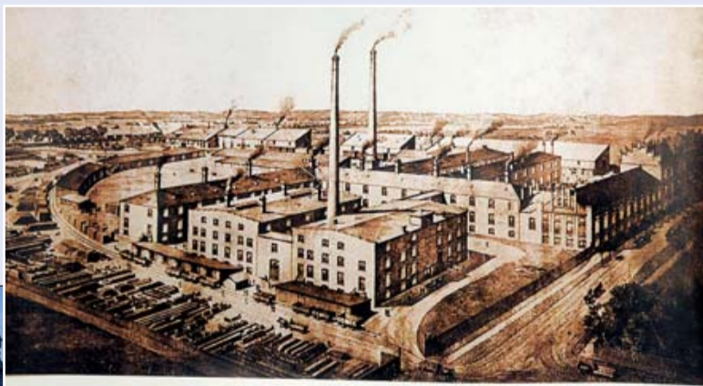
A Budapesti Zsolnay-féle Porcelán-fayance gyár látképe a két világháború közötti időből