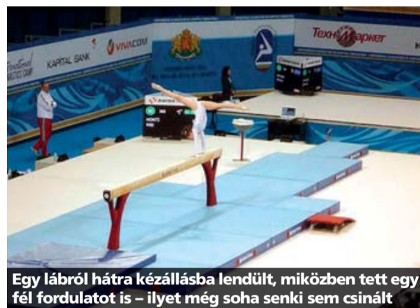
Egy lábról hátra kézállásba lendült, miközben tett egy fél fordulatot is - ilyet még soha senki sem csinált