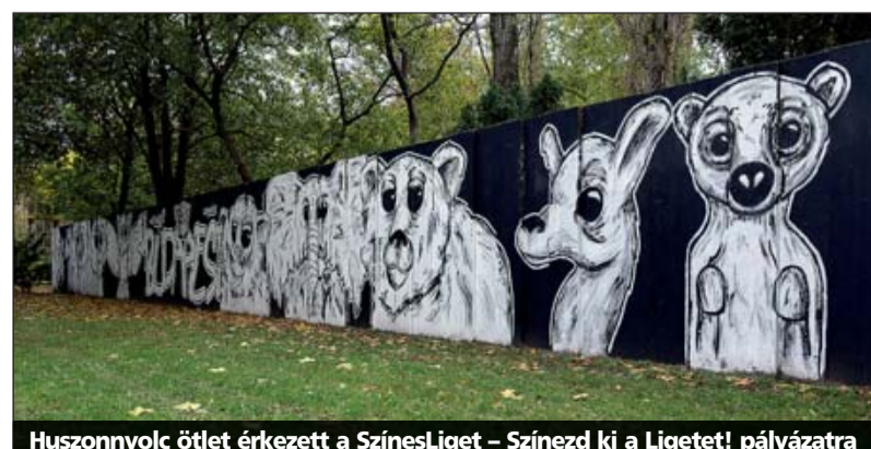
Huszonnyolc ötlet érkezett a SzínesLiget – Színezd ki a Liget! pályázatra

A betonfalakat egyébként a közpark teljes megújítása során majd