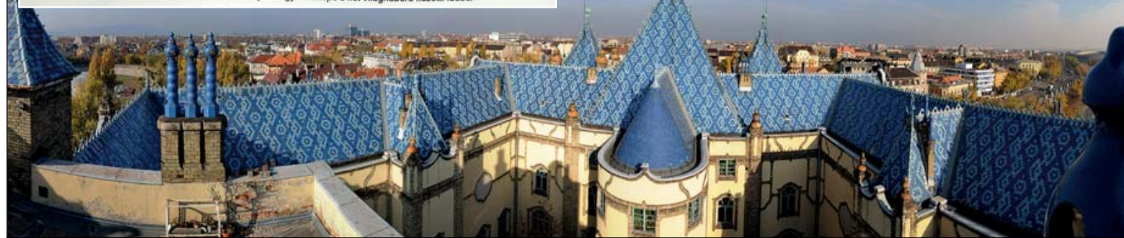
A Zsolnay-gyár bár Pécsen működik, Zuglóban is volt alkotóműhelye, a Stefánia úton lévő földtani intézet tetejét is Zsolnay tetőkerámia borítja