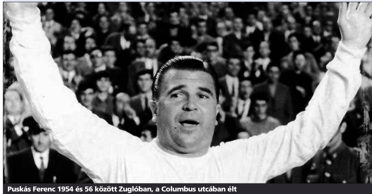
Puskás Ferenc 1954 és 56 között Zuglóban, a Columbus utcában élt

„A Zsolnay Porcelánmanufaktúra már több mint 150 éve jelképe, szimbóluma Pécs városának és Magyarországnak” – írja katalógusában a Hungarikum Bizottság. „Az egyedi fejlesztésű technológiákra épülő gyártás kiváló minőségű és egyedi esztétikai minőséget eredményez. A gyár