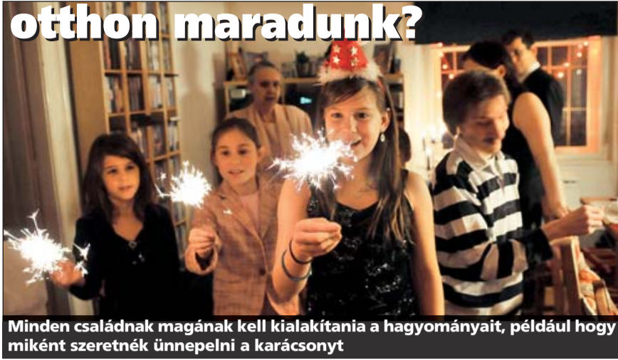
Minden családnak magának kell kialakítania a hagyományait, például hogy miként szeretnék ünnepelni a karácsonyt

Sokszor azonban ez a nagyszülők merev elutasításával találkozhat. Érthető módon, hiszen így hirtelen üresnek érezhetik a házat, értelmetlennek az ünneplést, önmagukat pedig öregnek és elhagyatottnak. Léteznek jó kompromisszumok: átmehetnek más időpontban, jöhetnek hozzánk ők, vigyázhatnak délelőtt az unokákra, ameddig apa és anya feldiszi a fát. Nagyon fontos, hogy minden családnak magának kell kialakítania a hagyományait. Nem érdemes elviselni, ha valami nem tetszik, vagy másként szeretnék. A férjnek és a fele-