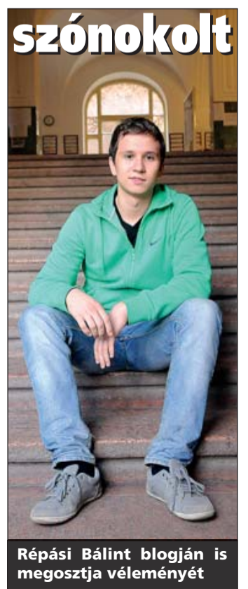
Répási Bálint blogján is megosztja véleményét