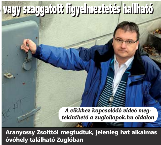
A cikkhez kapcsolódó videó megtekinthető a zugloilapok.hu oldalon

Jelenleg a kerületben hat alkalmas óvóhely ta-