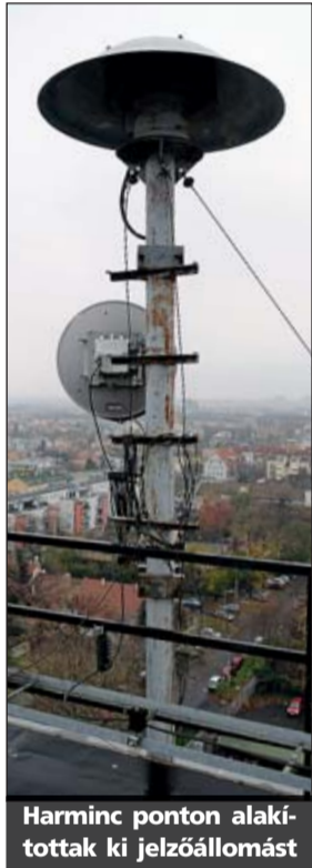
Harminc ponton alakítottak ki jelzőállomást

Katasztrófiariadó esetén mindenkinek azonnal fedett helyre kell vonulni, ahol az ajtókat, ablakokat be kell csukni, a szellőztetőt pedig ki kell kapcsolni.