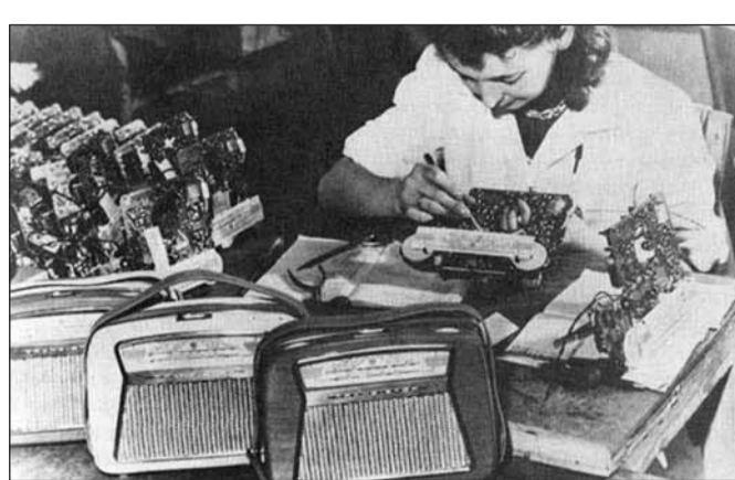
Táskarádiók összeszerelése (1958)

Az 1953-as, Nagy Imre nevével fémjelzett politikai irányváltás során minden, úgynevezett jelentős nemzeti vállalatot köteleztek arra, hogy polgári termékeket is