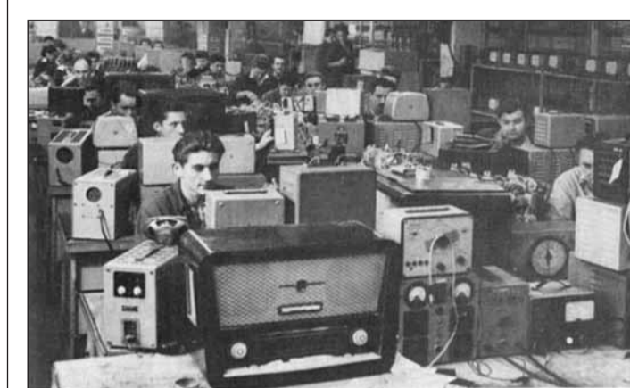
A rádióműhely 1954-ben

A cég jól kihasználta a háborús konjunktúrát: a Honvédelmi Minisztérium részére adó-vevőket, rádiótelefon-rendszereket, légvédelmi műszereket, telefonközpontokat és fotógéppuskát is gyártott, de jutott