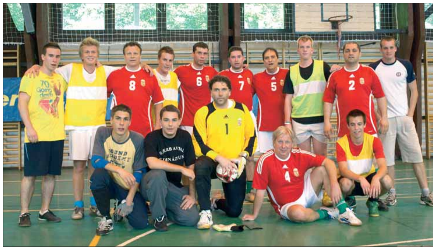
A médiaválogatott csapatában 6-os mezszámmal

örömet, ha magyar sikerekről számolhattam be a nézőknek. Az ilyen sikerek tolmácsolása egyrészt kiváltság, másrészt megtiszteltetés is egy sportriporter számára.