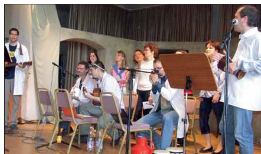
Első koncertjét adta április 21-én, István napon a Szent István Gimnázium Tech boys nevű tanárokból alakult zenekara

Tájékoztatása szerint több kerületi iskolában a megengedettnél lényegesen nagyobb volt a jelentkezők száma. Ezek az intézmények létszám-túllépési igényt nyújthatnak be a fenntartóhoz, ám ezek elbírálásához mindenképpen testületi döntés szükséges. Erre leghamarabb a május 17-i ülésen kerülhet sor. A szülők egy része ezt követően tudja majd meg, hogy felvették-e a gyermekét a kívánt intézménybe. Amennyiben elutasító választ kapnak, akkor is lesz segítség számukra, a Polgármesteri Hivatal Köznevelési Csoportja ugyanis minden zuglói gyereket el fog helyezni a kerület iskoláiban. riersch