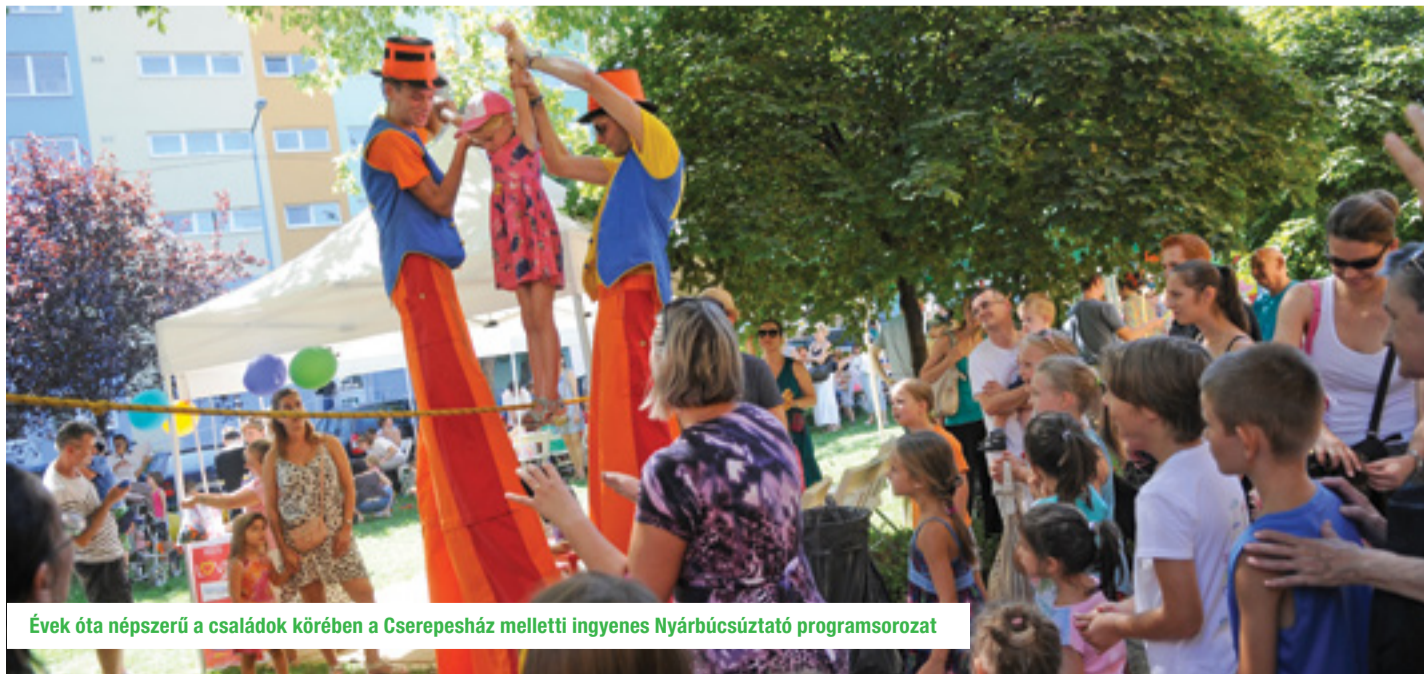
Évek óta népszerű a családok körében a Cserepes ház melletti ingyenes Nyárbúcsúztató programsorozat