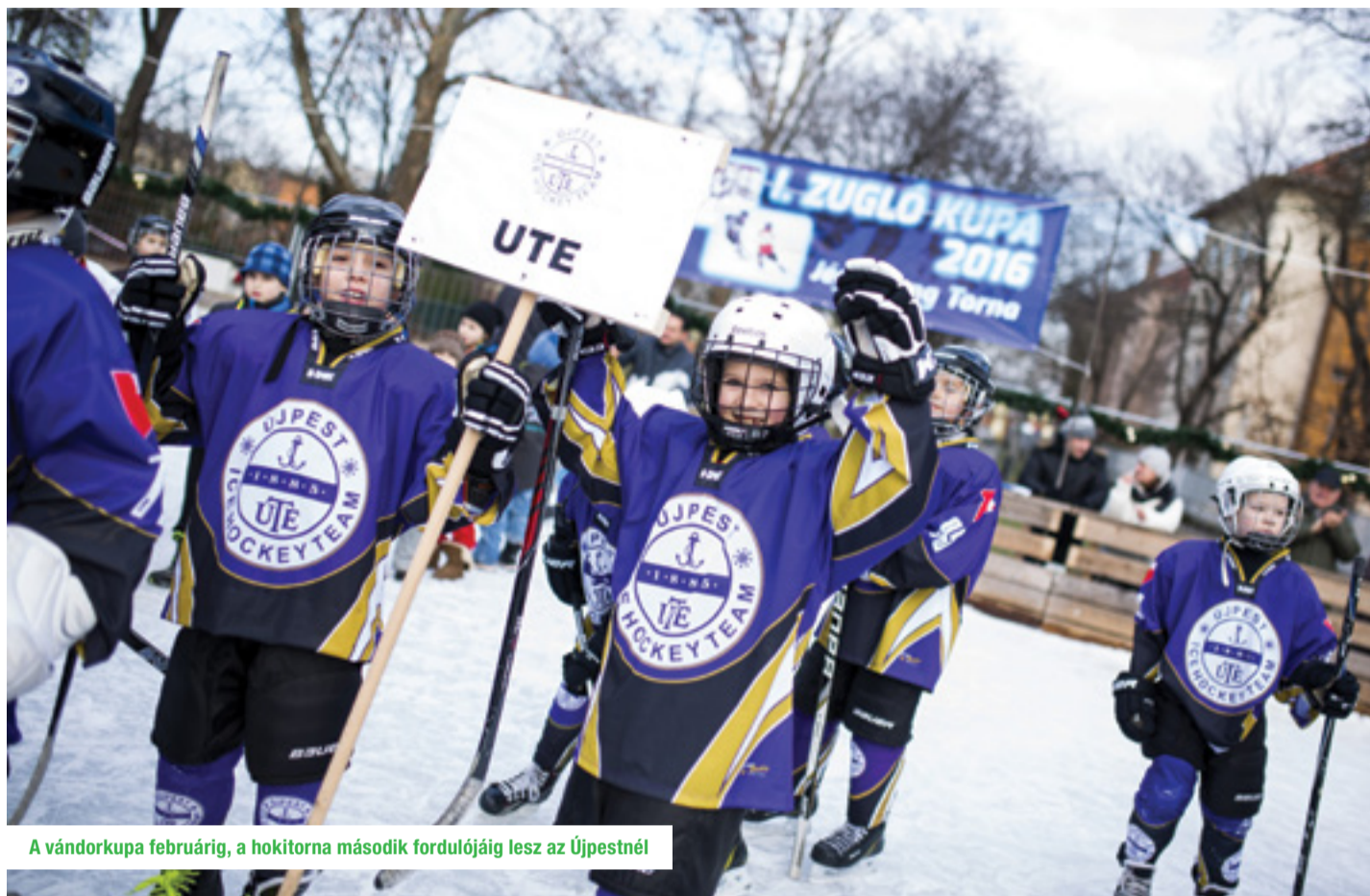
A vándorkupa februárig, a hokitorna második fordulójáig lesz az Újpestenél