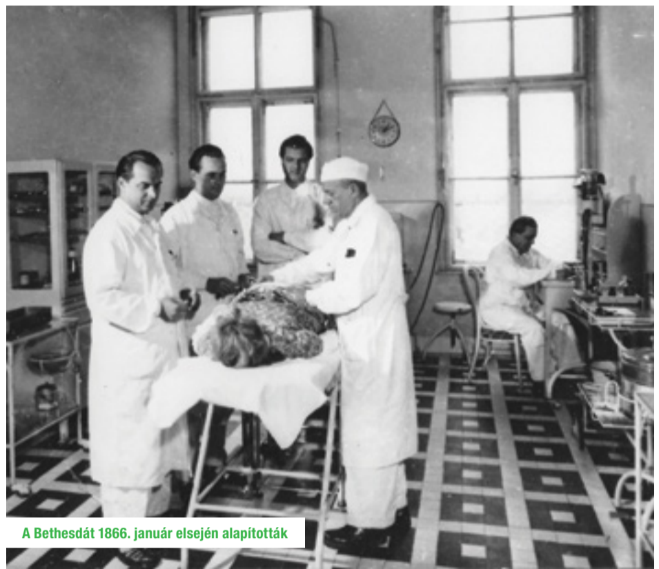
A Bethesdát 1866. január elsején alapították