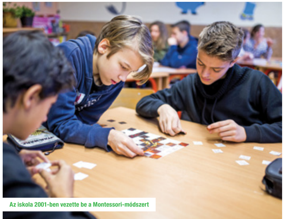
Az iskola 2001-ben vezette be a Montessori-módszert

– A Montessori-módszer jellegű oktatást azzal szokták vádolni, hogy túlzottan nagy szabadságot hagy a gyerekeknek, ami a fegyelmezés rovására megy. Az igazság azonban éppen ennek az ellenkezője: a gyerekek „szabadsága” nagyon komolyan vett szabályokra épül, és ők ennek megfelelően viselkednek – magyarázta Földesné. – Évek óta nincsenek kirívó magatartás-problémáink, pedig a módszer