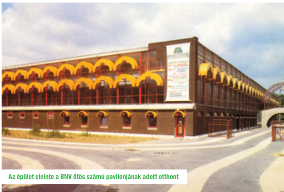
Az épület eleinte a BNV ötös számú pavilonjának adott otthont

Zuglói séták címmel új rovatot indítunk lapunkban. Minden számban bemutatjuk a kerület egy nevezetes vagy kevésbé ismert épületét, létesítményét, megkérdezzük az utca emberét, hogy mit tud róla, milyen emlékei vannak azzal kapcsolatban. Felelevenítjük a meglátogatott objektum történetét, régi és friss fényképek segítségével megmutatjuk, hogyan nézett ki egykor, és milyen ma. Sétáink során lesz, hogy egy-egy érdekes zuglói személyiséget is felkeresünk. Első alkalommal a könnyűzene kedvelői körében jól ismert Petőfi Csarnokot mutatjuk be, amelynek bontását várhatóan februárban kezdik el.