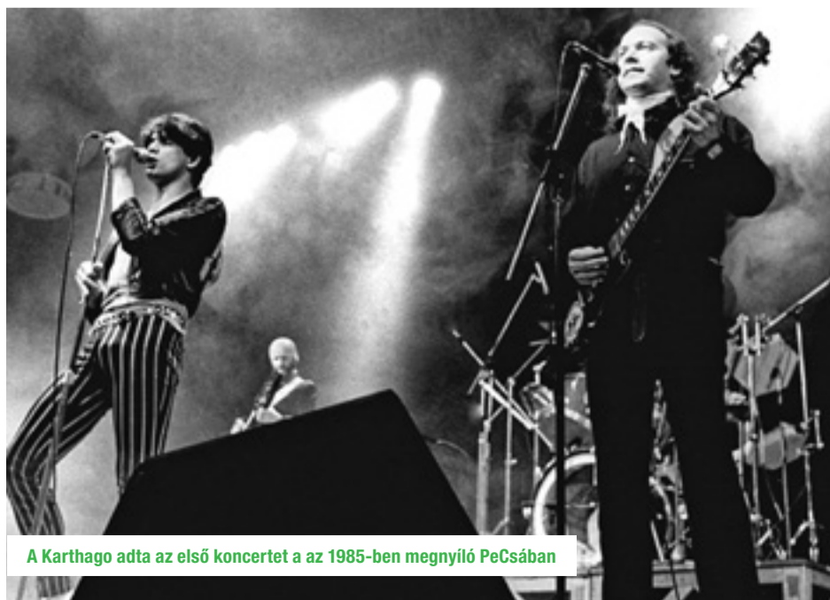
A Karthago adta az első koncertet a az 1985-ben megnyíló PeCsában