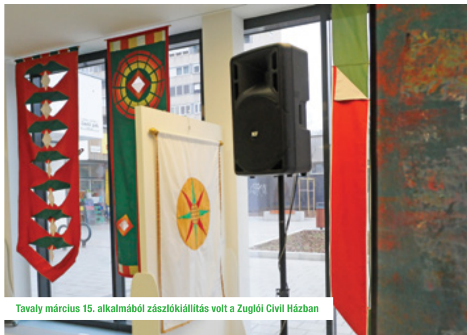
Tavaly március 15. alkalmából zászlókiállítás volt a Zuglói Civil Házban

– Az Ajtosi Dürer sori épület az ország és Közép-Európa kortárs képzőművészeinek a kiállítóhelye. Itt olyan alkotók mutatkoznak be, akik nem a klasszikus művészeti ágakat képviselik, inkább alternatív, extrém eszközökkel fejezik ki gondolataikat. Ez a tagintézményünk kultikus helynek