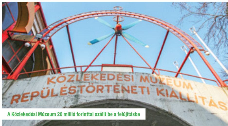
A Közlekedési Múzeum 20 millió forinttal szállt be a felújításba

Az ambiciózus elképzelések megvalósítására a Fővárosi Tanácsnak csak 42 millió forintja volt, mert a nyugati világot sújtó gazdasági válság kezdett begyűrűzni hazánkba. Ezért az ifjúsági szervezetek segítségét kérték. Az Állami Ifjúsági Bizottság 12 millió, a KISZ Központi Bizottság 30 millió, a KISZ Budapesti Bizottsága pedig 9,8 millió forintot ajánlott fel. Így már 93,8 millió forint állt rendelkezésre, ami még mindig kevés volt, ezért további forrást kerestek. Ekkor került képbe a Közlekedési Múzeum, amely már korábban is szeretne volna megszerezni a csarnoknak legalább egy részét. Hamarosan megszületett a megegyezés, a Közlekedési Múzeum 20 millió forinttal szállt be a rekonstrukcióba.