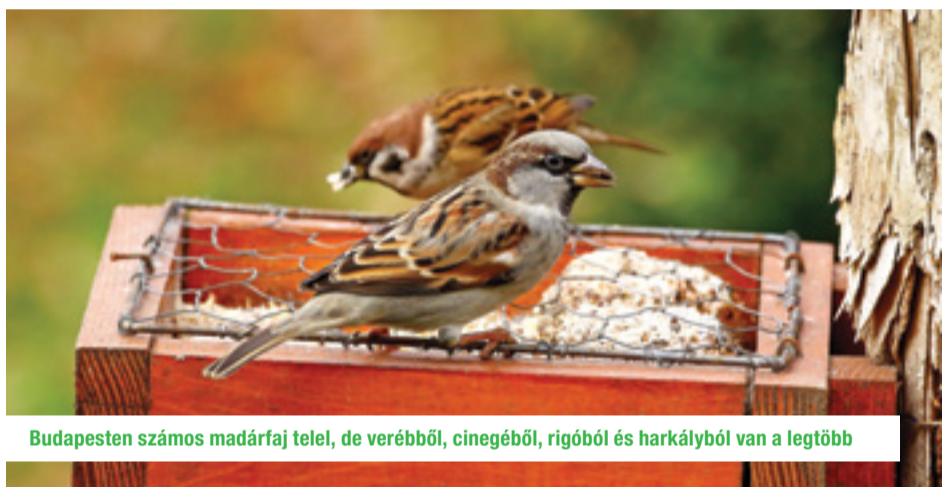
Budapesten számos madárfaj telel, de veréből, cinegéből, rigóból és harkályból van a legtöbb