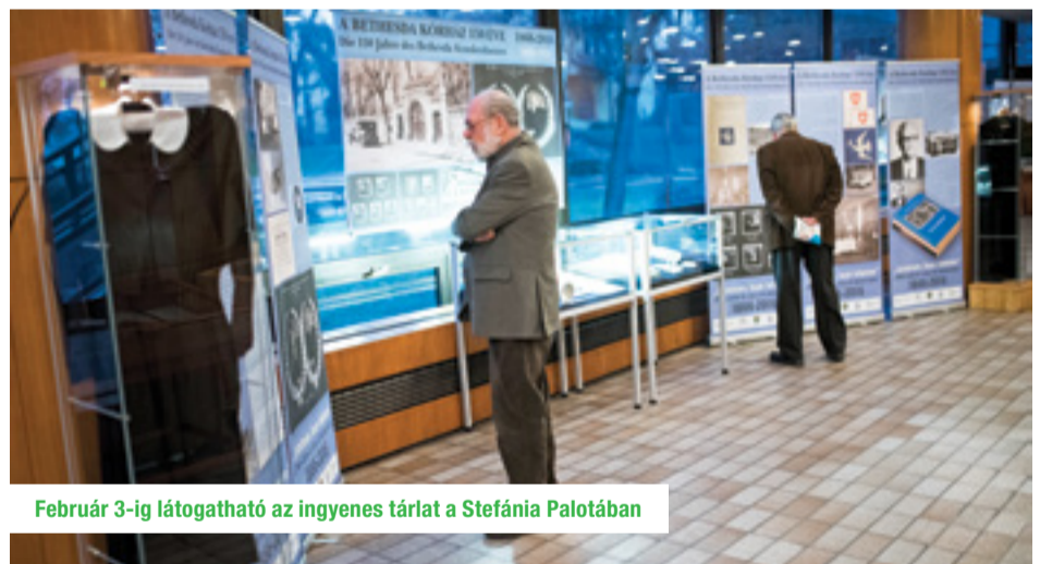
Február 3-ig látogatható az ingyenes tárlat a Stefánia Palotában