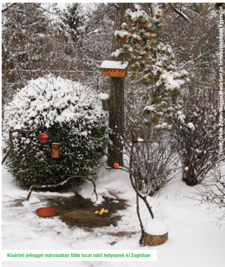
Kísérleti jelleggel márciusban több tucat odút helyeznek ki Zuglóban