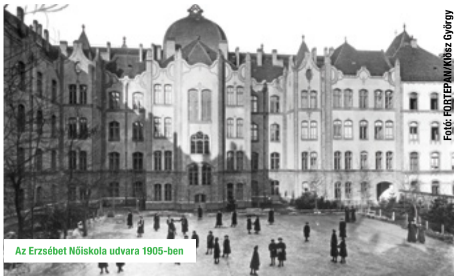
Az Erzsébet Nőiskola udvara 1905-ben