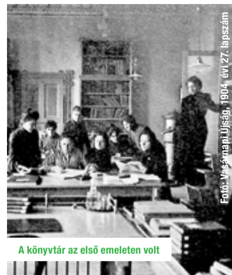
A könyvtár az első emeleten volt

A tanítóképzés 1930-ig folyt Budapesten,