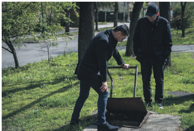
A kerületbejárás során számos rendellenességet tártak fel