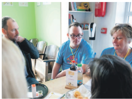
Az elfogadásról, egyenlős bánásmódról és autonómiáról is beszélgettek a Down szindróma világnapi brunch-on