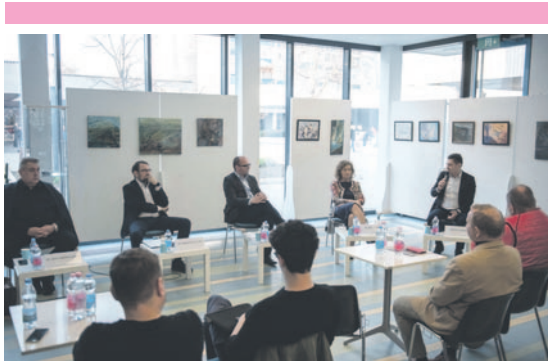
A szakemberek elfogadhatatlannak tartják az államosítás ötletét