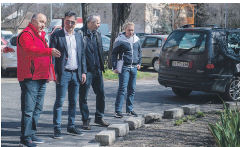
A zöld területek védelme minden körzetben központi kérdés volt