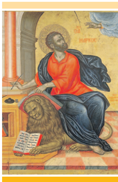
A velenceiek védőszentjükként tisztelik Szent Márkot

Az apostolokhoz 44-ben csatlakozott, amikor a Júdeában dúló éhínség miatt az antiochiai egyház két apostola adományt vitt a nélkülözőknek. Márk édesanyjának házában szálltak meg, teljesítve küldetésüket Márk elkísérte őket Antiochiába. Egy évvel később Péterrel elzarándokolt Ciprus szigetére, ahol ő volt a tolmácsa. 50 és 60 között lejegyezte az apostol prédikációit, amiből később megszületett Péter evangéliuma. Egyiptomban 12 éven át térített, a kopt orto-