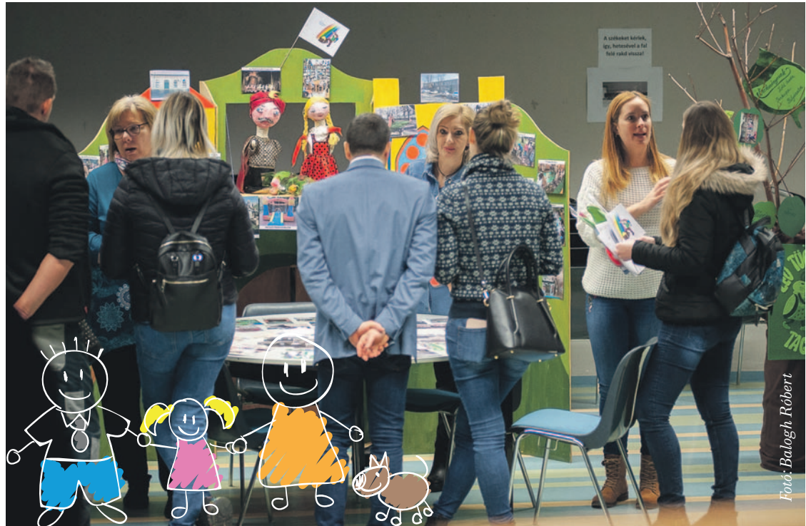
A szülők megismerkedhettek a tagóvodák életével és képzési sajátosságaival

Valamennyi tagóvoda kiemelt feladatának tekinti a gyermekek környezettudatos szemléletének kialakítását. Tevékenységével a Hétszínvirág, a Kerékgyártó, a Mályva, a Mókavár, a Pöttöm Park, a Rózsavár, a Tücsöktanya, az Örökzöld és a Tihany Óvoda mindegyike el-