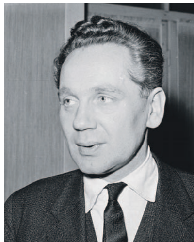
Állásából elbocsátva műfordításból és forgatókönyvírásból élt

1942-ben ösztöndíjasként került Genfbe, ahol 1946-ban a Bibliothèque Hongroise igazgatója lett. Svájcban töltött éve alatt francia anyanyelvű barátaival főleg József Attila verseinek fordítását szorgalmazta és magyar művészeket segített genfi ösztöndíjhoz. 1950-ben tért haza Budapestre, ahol a Színház- és Film-művészeti Főiskolán tanított, majd a Nemzeti Színház dramaturgja lett. 1956-ban a Szabad Magyar Rádió irodalmi adásait vezette, ezért mindkét állásából elbocsátották. Mű-