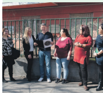
Az irodalom iránti rajongás közös bennük

– Tagságunk többsége családos ember. Van köztünk olyan, akinek már jelent meg kötete, de olyan is, akit