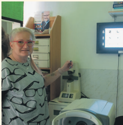
A látásvizsgálatot speciális céleszközökkel végzi

– A látásterész szakma sokszínű, az ember szakosodhat szemüvegjavításra,