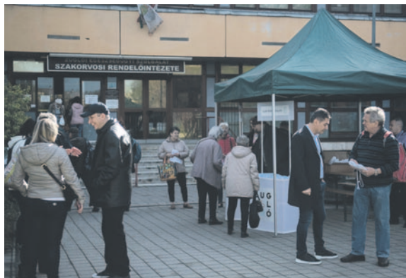
A fogadóórán Zuglóval kapcsolatban bár miről lehetett kérdezni

A fogadóórákon többen is hangot adtak nemtetszésüknek a Bayer Construct Bosnyák tér mögötti befektetői fejlesztésével kapcsolatban. A találkozókön téma volt a