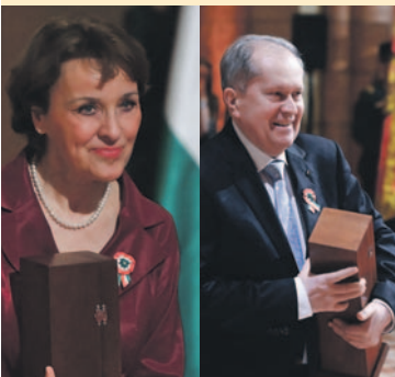
Záborszky Kálmán karnagy

Dr. Solymosi-Tari Emőke zene-pedagógus