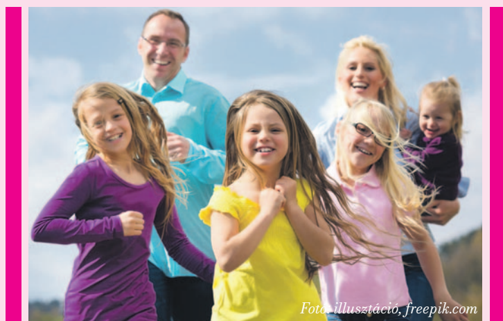
Fotó: illusztráció, freepik.com