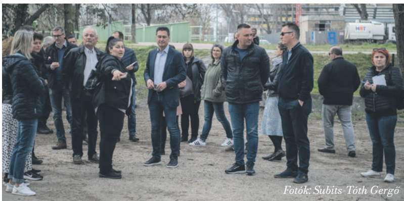
A szemlék az önkormányzati szervek bevonásával zajlottak