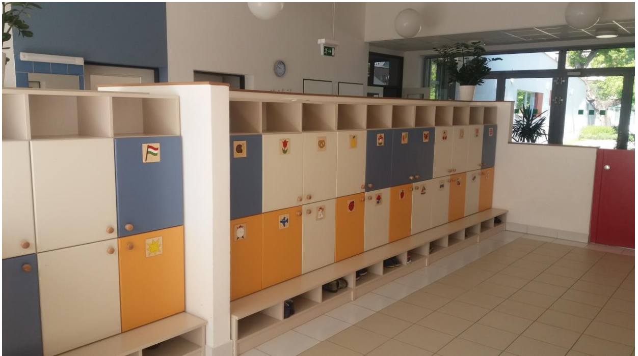
Az aula és az átadó