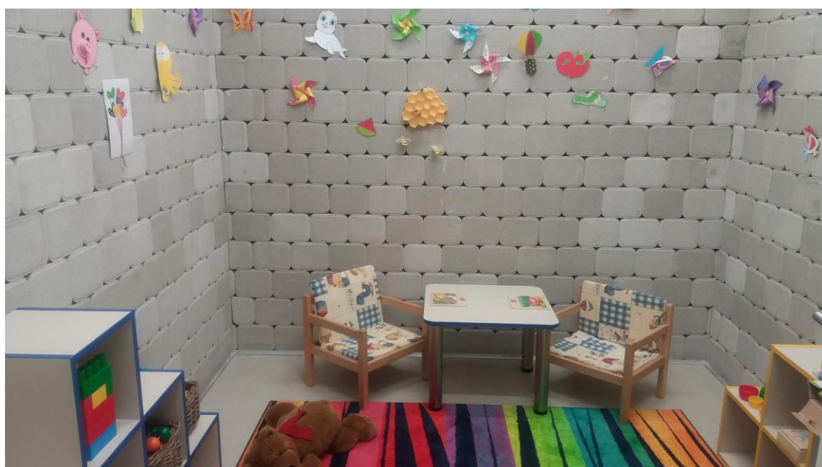
Torna és szószoba