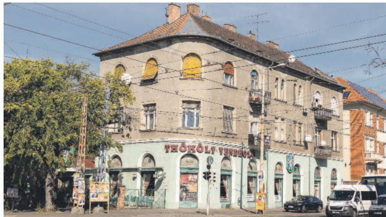
Kegyetlen kínzások és gyilkosságok színhelye volt a Thököly út 80. alatti épület