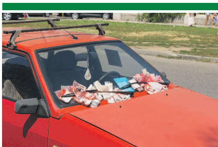
Hónapokon át foglalják a parkolóhelyet

KRESZ 59. § (3) bekezdése – csak a hatósági jelzés nélküli járművek elszállítására van mód. A rendszámablával rendelkező járművek a hatályos jogszabályok szerint nem szállíthatók el, akkor sem, ha lejárt a műszaki érvényességük, vagy a státuszuk forgalomból kivont. Az üzemképtelen jármű tárolására közterület-használati engedélyt kell beszerezni az illetékes önkormányzattól. Ennek alapján is csak 90 napig mellékútvonalon állhat a jármű. Amelyik akadályozza a forgalmat, vagy balesetveszélyt jelent, gyorsan elszállítható. Egyéb esetben a bejelentést követően a közterület-felügyelet járőre a járművet ellenőrzi, amennyiben az a hatályos jogszabályok szerint „hatósági jelzés nélküli”, értesítést helyez a szélvédőjére és fotódokumentációt készít. Ha tíz nap elteltével az autó továbbra is a közterületen áll, a hatóság megrendelheti az el-