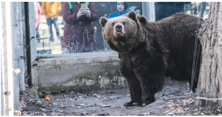
A kíváncsi 12 éves barnamedve, Balu

Idén is megtartották a hagyományos medveárnyék-észlelést a Fővárosi Állat- és Növénykertben a 12 éves barnamedve, Balu segítségével. Az állat az elmúlt időszakban kissé szegycellős volt, ezért a gondozók arra számítottak, hogy ha kinyitják a lakhelye ajtaját, nehezen akar majd előkecmergni. A szakemberek ezért különböző finomságokat és játékokat készítettek be neki a kifutóra. Balut pedig hajtotta a