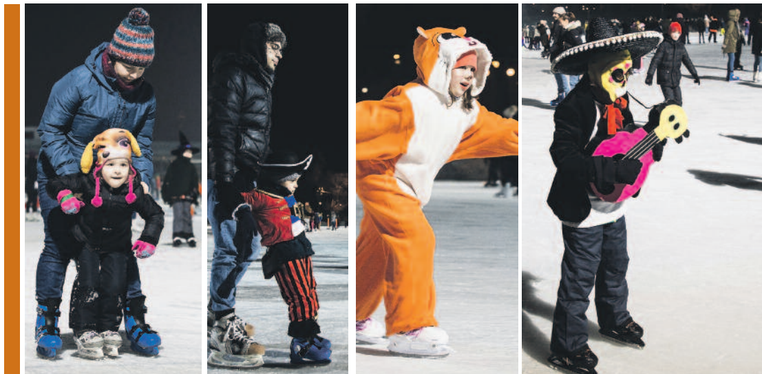
Az idén is jégre vitte farsangját a Liszt Ferenc Általános Iskola és a Hajós Magyar-Német Két Tanítási Nyelvű Általános Iskola