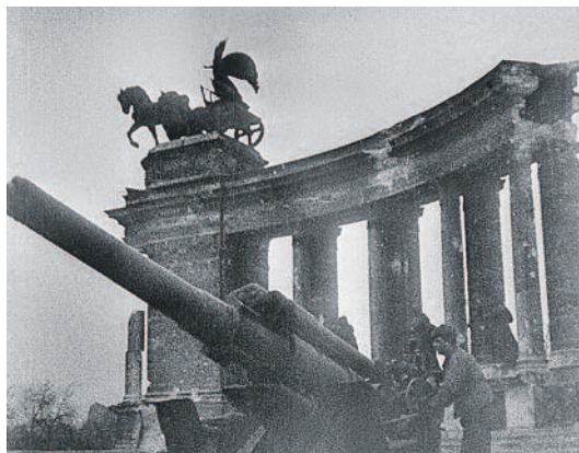
Szovjet tüzerállás a Hősök terén

1944 nyarán már látszott, hogy a háború elveszett. Ennek ellenére nem volt törvényszerű, hogy Budapest frontvárossá váljon. Romániának a háborúból való kilépése után azonban Magyarország hadászati szempontból felértékelődött.