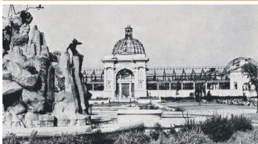
Az elpusztult Világító szökőkút és a kiégett Iparesszárnok

A pesti hídfő 1945. január 18-án elesett. A német hadvezetés három alkalommal kísérelte meg az ostromzár feltörését, azonban a Konrád-hadműveletek rendre kudarc-