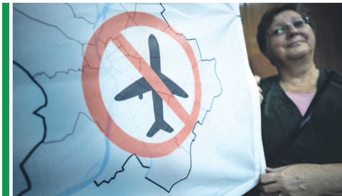
A közmeghallgatáson megint téma volt a légtérzaj