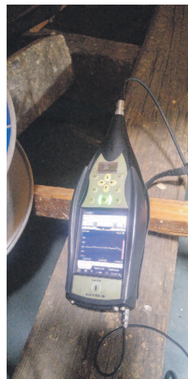
Az ANTIZAJ mérése a polgármesteri hivatal padlásán

gépek 19 és 21 óra között, a leszállók 19 és 20 óra között voltak a leghangosabbak, míg a legkevésbé hangos járatok 22 és 23 óra között szálltak fel, és 5, illetve 6 óra között lan-