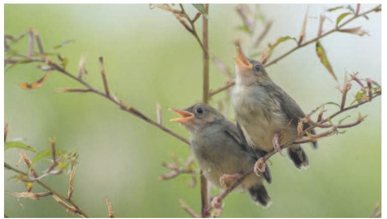
Védenünk kell az énekesmadarakat