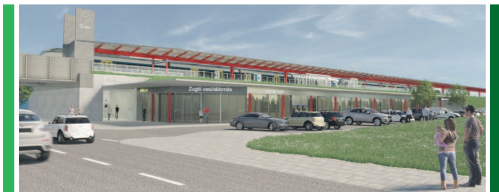
A MÁV látványterve Zugló vasútállomásról

A Közlekedő Tömeg Egyesület közérdekű adatigényléssel fordult a MÁV-hoz, válaszukból kiderül, hogy a felújítás ugyan a kiviteli terveknek megfelelően készült, de az is, hogy nem készítettek tervdokumentációt, mert csak „komfortnövelő karbantartás történt”. Ez meglehetősen abszurd annak fényében, hogy 293,6 millió forintot költöttek az igénytelen munkára, amely semmiféle komfortnövekedést nem hozott: továbbra is szűk, hepehupás peron várja az utasokat, és az akadálymentesítésről sem gondoskodtak. Ebből az összegből akár a tervezett új, végleges váróterem, üzletek, pénztár és mellékhelyiség elhelyezésére alkalmas utcaszíni állomásépületet is megépíthették volna, amely színvonalas szolgáltatásaival valós komfortnövekedést jelentett volna.