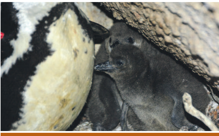
Karácsony előtt születtek a kis pápaszemes fiókák