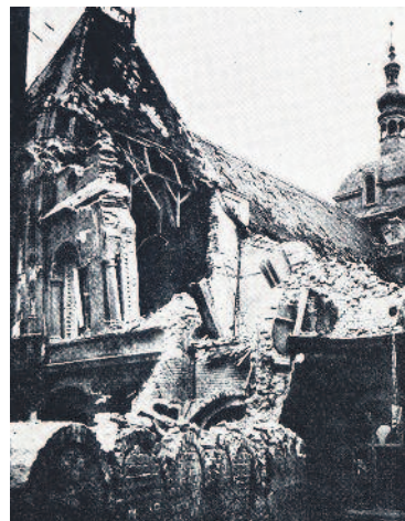
A romos Vajdahunyad vára

ba fulladtak. Február elejére a Budai vár körüli szűk területre szorult német–magyar védőse-