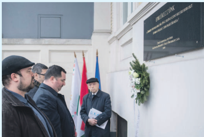
A holokauszt magyarországi áldozatainak emléknapján koszorúztak