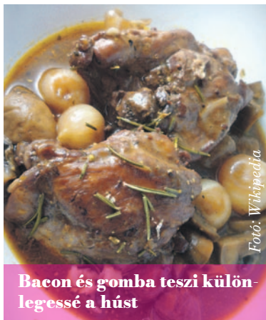
Bacon és gomba teszi különlegessé a húst

750 ml száraz vörösbort 3 babérlevéllel, 1-1 csokor (vagy 1-1 kk. szárított) petrezselyemmel, kakukkfűvel, zsályával, rozmaringgal 6 db csirkecombot egy éjszakán át pácolok. Másnap 5-6 ek. olajon 400 g felaprított bacont lepirítok, kiviszem egy tálra, majd 500 g szeletelt csiperkegombát is lesütök ebben, és kiszedem. A combokat kiviszem a pácból, szárazra törlöm, megsózom, megborsozom, majd olajban barnára sütöm és félreteszem. 2 fej hagymát, 4-5 gerezd fokhagymát lepirítok az olajon, hozzáöntök 1 ek. para-