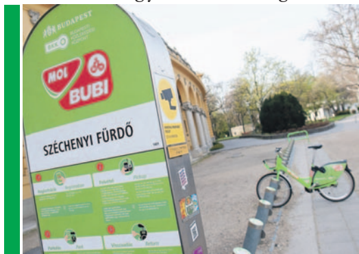
Már összesen 2260 bringa van forgalomban, a gyűjtőállomások száma pedig elérte a 183-at

zeljövőben valósulnak meg ezek a fejlesztések, „a társadalmi egyeztetésben megha-