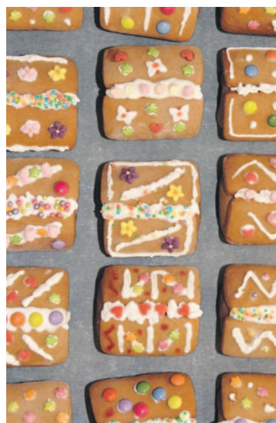
A lurkók is elkészíthetik ezt az egyszerű édességet

A cukormáz elkészítéséhez a 4 tojásfehérjéhez 200-250 g porcukrot keverek.