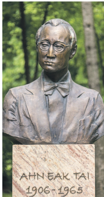
A koreai himnusz szerzője 1938–1941 között tanult a Zeneakadémián

zottság kommunikációs igazgatója mondott beszédet. A talajon álló emléktáblán az avatáskor 30 név szerepelt, amely azóta 12 névvel gyarapodott. Az emlékművön a felnőtt bajnokok mellett a paralimpián, az ifjúsági olimpián és a sakkolimpián győztes zuglói sportolók nevei is szerepelnek. „Jobb ma egy karikatúra, mint holnap egy diktatúra!” – olvasható Kaján Tibor emléktábláján az elhíresült mondása. Az Aranytollas, Pulitzer-emlékdíjas és Tánacsics Mihály-díjas grafikusnak, karikaturistának Zugló önkormányzata a Magyar Újságírók Országos Szövetségével (MÚOSZ) közösen emelt emléktáblát Örs vezér téri lakóhelyének falán. Az avatóünnepséget 2018. május 24-én tartották. Az eseményen megjelentek Bogárn Nándor újságíró, Kaján Tibor egykori munkatársa köszöntötte, majd Karácsony Gergely polgármester és Hargitai Miklós, a MÚOSZ elnöke