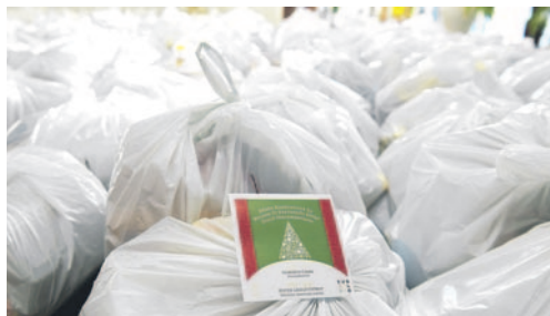
Az önkormányzat tavaly 396 babacsomagot és 1609 karácsonyi csomagot állított össze