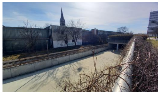
K-Közl építési övezet déli telekhatára

A fentebb felsorolt indokok alapján az alábbi előírás javasolt a ZKÉSZ módosító rendeletében: