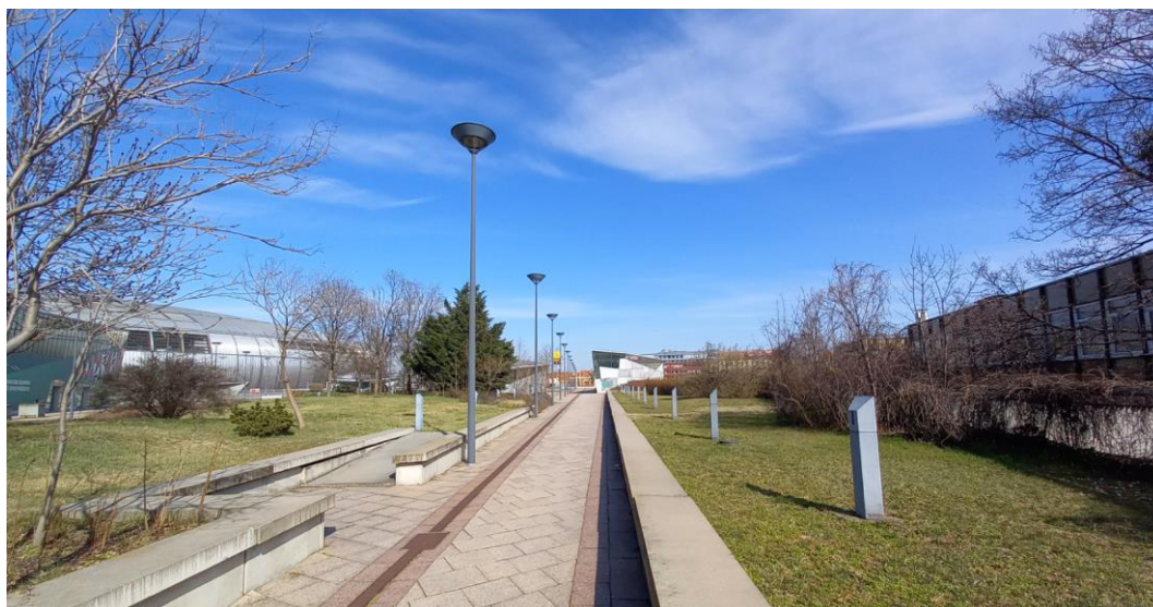
Papp László Budapest Sportaréna előterét képző deck

A Korm. rendeletben nevezett telekalakítási eljárás megtörtént, kialakításra került a hatályos ZÉSZ szerinti szabályozás szerinti 32538/1 hrsz.-ú telek. A nevezett telek egésze a Vi-1/8 építési övezetbe sorolt, ahol a kötelező beépítés módja zárt sorú. A telek tervezett beépítése esetén az északi telekhatáron álló homlokzat kialakítása az OTÉK rendelkezései alapján tűzfalas kialakítással lenne lehetséges, azonban a szomszédos északi K-Közl építési övezetben sorolt telek (autóbusz pályaudvar, parkoló, jegypénztárak, múzeum) adottságait és városképi szempontokat is figyelembe véve a tűzfal megjelenése a Papp László Budapest Sportaréna előterét képző „deck”-en nem kívánatos. Nevezett adottságok, valamint az M2 metró kéreg alatti állomása miatti kötöttségek figyelembevételével javasolt, hogy a Vi-1/8 építési övezet felülépítésekor, a szomszédos építési övezettel közös telekhatáron álló homlokzat kialakításakor az OTÉK 36. és 37.§-ai vonatkozó rendelkezéseitől eltérően, eltérési engedéllyel a ZKÉSZ-ben megengedhető legyen a csatlakozó telekhatáron a homlokzat nem tűzfalas kialakíthatósága.