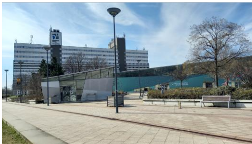
P6 parkoló lejárata

A Vi-8 és K-Közl telekhatárhoz leközelebb álló építmények: