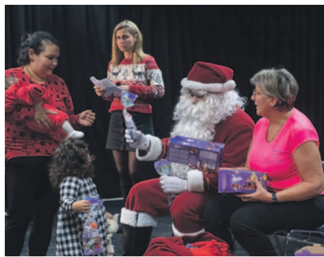
A Mikulás minden gyereknek csomagot, az önkormányzat minden családnak szaloncukrot ajándékozott