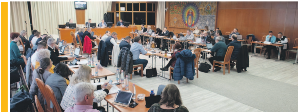
A testület elutasította a Rákosrendező területére tervezett mini-Dubajnak nevezett gigaberuházást

A képviselő-testület elutasítja a sajtóhírek szerint Rákosrendezőre tervezett 200 méternél magasabb felhőkarcolót és több tízezer lakást magába foglaló gigaberuházást, derült ki a képviselő-testület ülésén, amelyen a szociális támogatások bővítéséről és a szilveszteri tűzijáték betiltásáról is döntöttek.