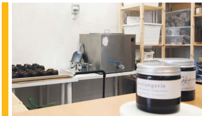
Egy nagy fémkockában olvasztják meg a szójaviaszt