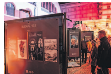
151 grafikusművész alkotása

város cégeinek legkitartóbb munkavállalóit mutatta be. A Merlin Színházban egykori alapító tagja, Jordán Tamás, a nemzet színésze mesélt a teátrum múltjáról. Az emlékévkapcsán készült, 23 kortárs szerző művét tartalmazó Budapest Nagyregény fejezetei is megelevenedtek. Bemutatkozott Budapest hivatalos születésnapi tortája is, amely a Natalis fantázianeveket viseli, és a belvárosi Auguszt Cukrászda versenygyőztes alkotása. A desszertet Zuglóban a Fogarasi Pékség és Cukrászdában, valamint a Vadon Café cukrászdában forgalmazzák. Az ünnep alkalmából november 17-én 150 forintos jeggyel lehetett belépni Budapest kilenc strandjára, köztük a Paskál és a Széchenyi fürdőbe. I. S.