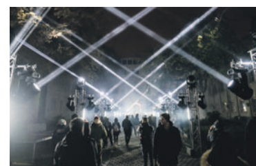
Fényfolyosó a Városháza udvarán