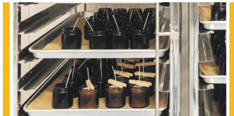
Az üvegtartókban egy csipesszel rögzítik a pamutkanócokat