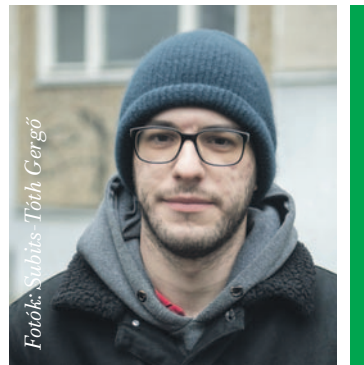
Fotó: Subits-Tóth Gergő